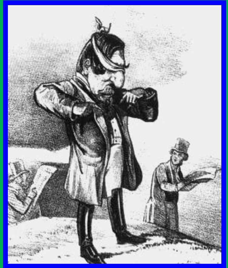
Карикатура на Наполеона III. «Еду в Крым, не еду в Крым»

Но неожиданно для Николая I, Запад решил вмешаться в войну. Англия рассчитывала получить Египет и Крит без помощи русских. Наполеон III нуждался в «маленькой победоносной войне» для укрепления своего авторитета во Франции. Австрия и Пруссия опасались усиления российского влияния на Балканах.