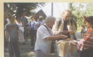
Встреча потомков Бобринских из Англии в музейном комплексе «Бобринки»