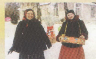
На празднике «Широкая Масленица»