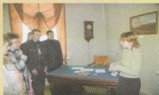
В одном из залов экспозиции «Екатерина II и усадьба «Бобринки»