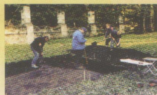
Археологические раскопки на территории музейного комплекса