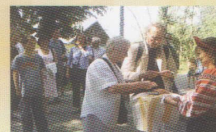
Встреча потомков Бобринских из Англии в музейном комплексе «Бобринки»