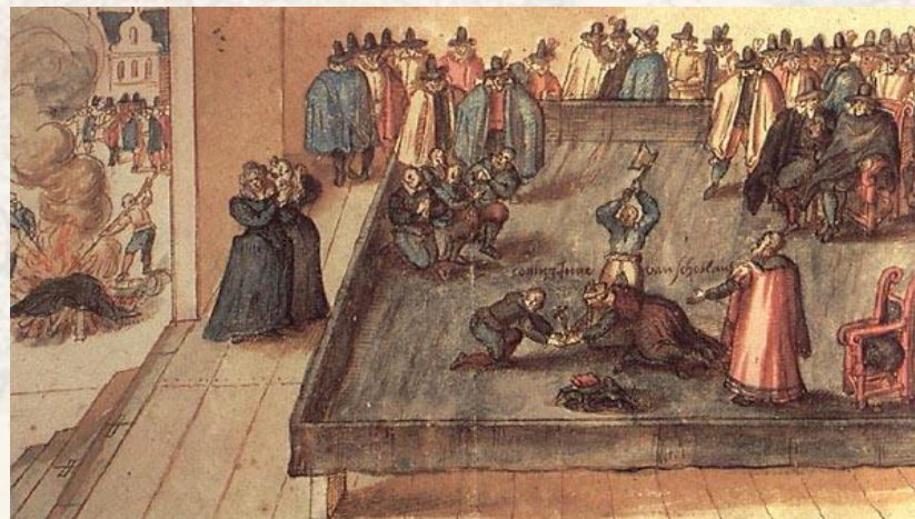
Казнь Марии Стюарт (1587 г.)

В 1587 году Мария Стюарт, претендовавшая на английский трон, была обезглавлена по приговору королевского суда. Эта казнь избавила Англию от угрозы религиозной войны и сохранило единство страны