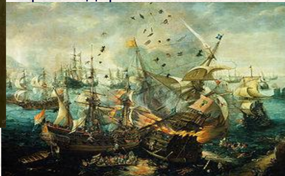
Гибель «Непобедимой Армады»

В 1588 году Филипп снарядил огромную эскадру. Её целью было завоевание Англии. Испанцы были разбиты, и Англия становится мировой морской державой