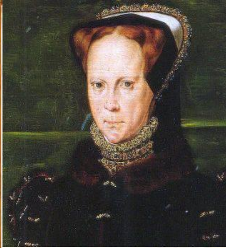
Портрет Марии I работы Х. Эурота, 1554г,