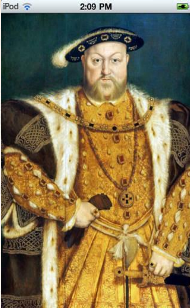
Король Англии Генрих VIII Тюдор (1491 -1547гг.)

Генрих Тюдор был противником Реформации, даже написал книгу против Лютера «В защиту семи таинств» (1521 г). За этот труд король получил от Папы титул «защитник веры». Но отказ Папы утвердить развод с Е. Арагонской и женитьбу на А.Болейн вынудили Генриха изменить свою позицию.