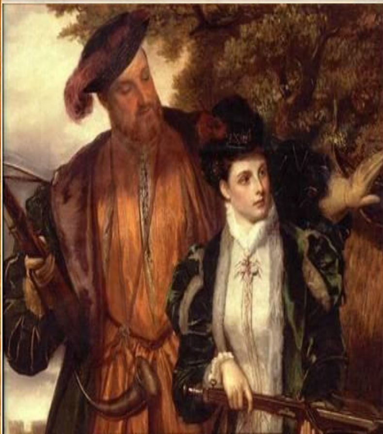
Король и юная Анна на охоте