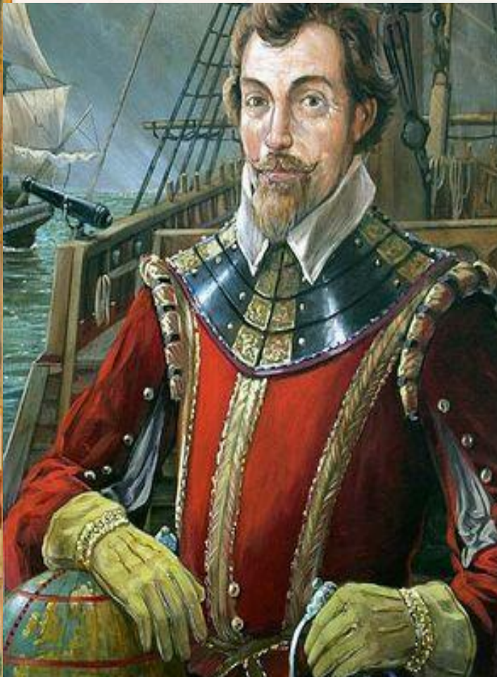
Адмирал и корсар Френсис Дрейк