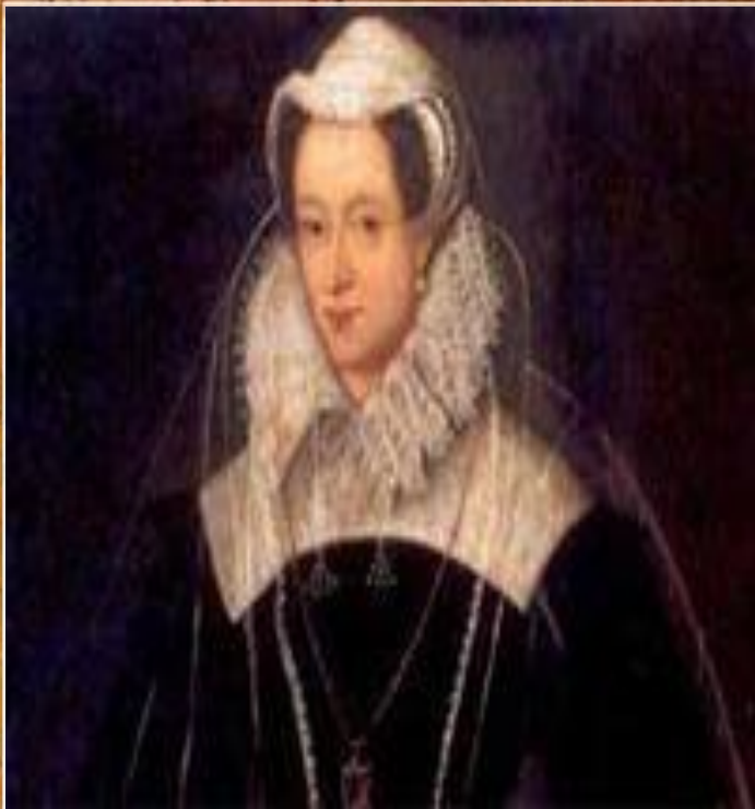
Мария Стюарт - королева Шотландии

В 1587 году Мария Стюарт, претендовавшая на английский трон, была обезглавлена по приговору королевского суда. Эта казнь избавила Англию от угрозы религиозной войны и сохранило единство страны