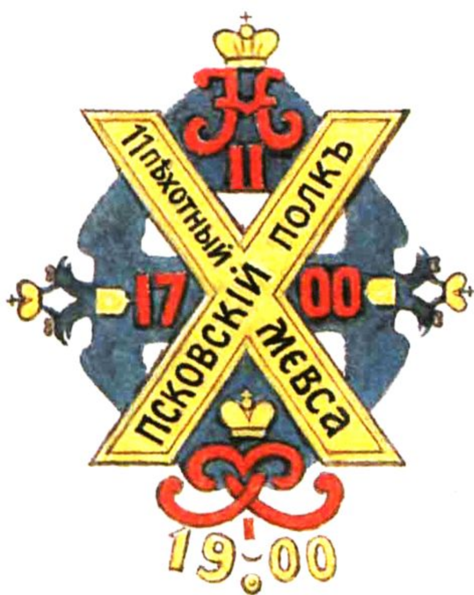
11-й Псковский пехотный полк