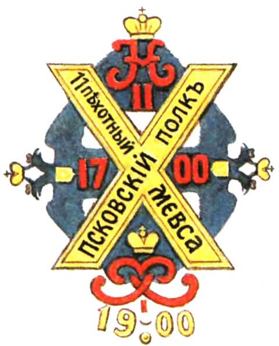
11-й Псковский пехотный полк