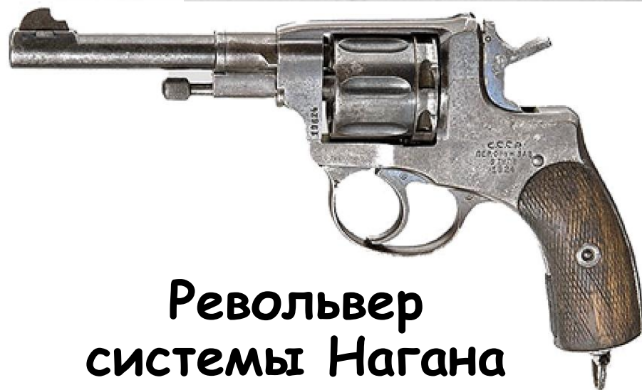
Револьвер системы Нагана