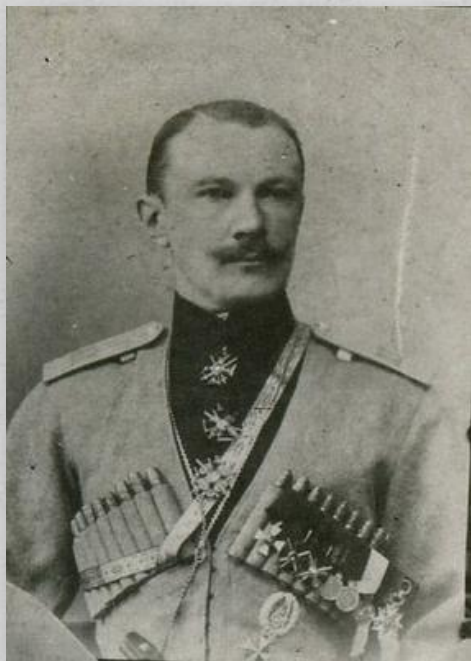
генерал-лейтенанты Г.Ф. Гилленшмидт и Д.П. Парский

К сожалению, многие из бывших офицеров - участников Первой мировой войны позже стали жертвами необоснованных репрессий конца 1930-х гг. и их символические могилы находятся на месте массовых расстрелов в Тесницком лесу. Среди наших земляков, участвовавших в Первой мировой войне, были и представители русского генералитета