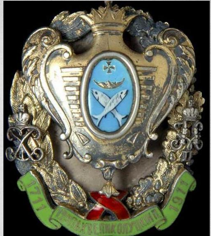
12-й Великолуцкий пехотный полк