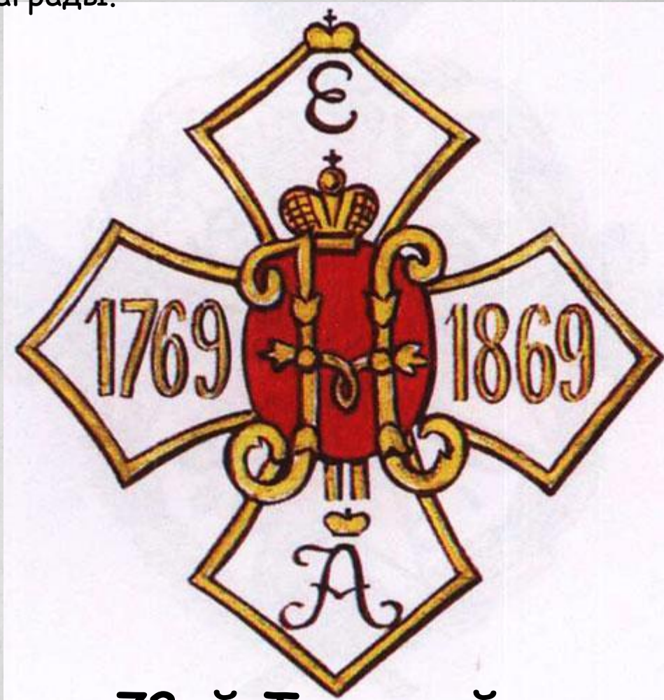
72-й Тульский пехотный полк