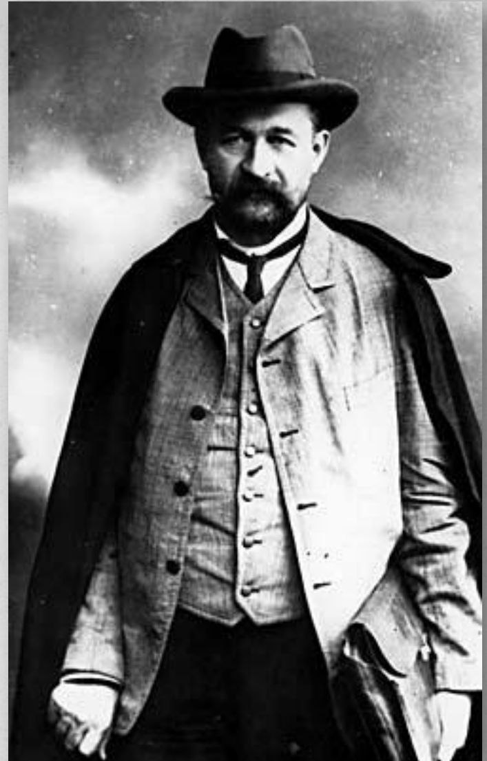
Князь Г.Е. Львов

Во время Первой мировой войны в России был создан Союз земств и городов (Земгор), который возглавил наш земляк князь Г.Е. Львов. Это организация оказывала помощь раненым, создавала госпитали и перевязочные пункты, снабжала воинов обмундированием, бельём, медикаментами, продовольствием.