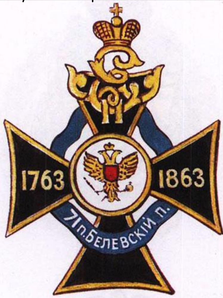
71-й Белёвский пехотный полк

Оба этих полка на полях Первой мировой войны показали себя с самой лучшей стороны. Многие их солдаты и офицеры получили воинские награды.