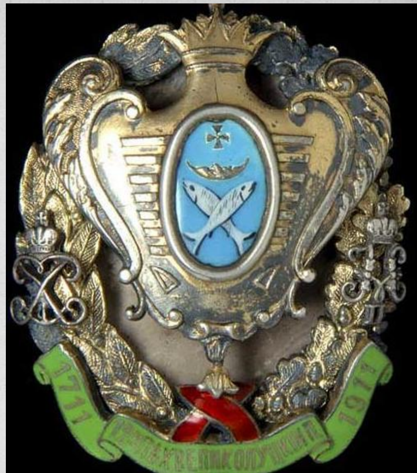
12-й Великолуцкий пехотный полк