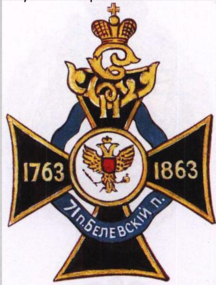
71-й Белёвский пехотный полк

Оба этих полка на полях Первой мировой войны показали себя с самой лучшей стороны. Многие их солдаты и офицеры получили воинские награды.