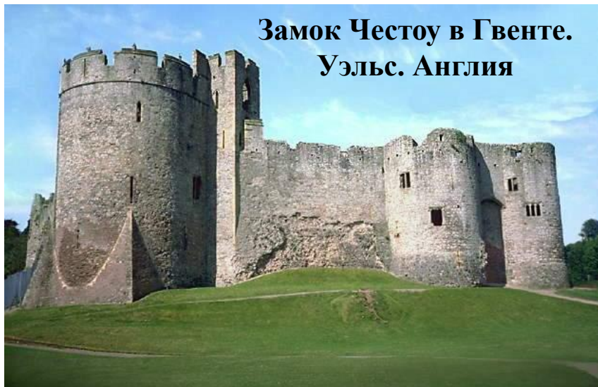
Замок Честоу в Гвенте. Уэльс. Англия