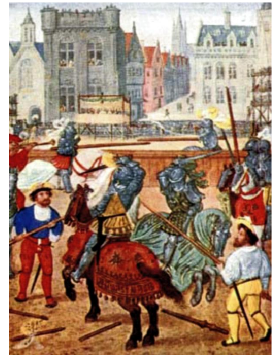
Турнир. Миниатюра из фламандского календаря начала XVI в. ►

Специальные глашатаи – герольды – объявляли имена рыцарей, вступающих в бой. Участники турнира, одетые в боевые доспехи, разъезжались в противоположные концы арены. По знаку судьи они мчались на конях навстречу друг другу.