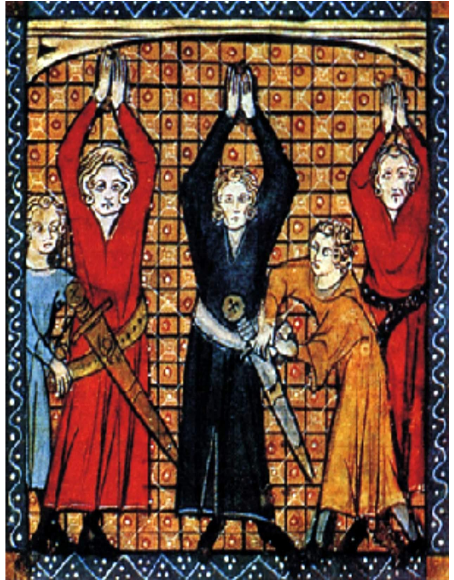
Опоясывание мечом – элемент посвящения в рыцари. Миниатюра начала XIV в.

Верность в служении сеньору или королю считалась особой доблестью. Измена и трусость позорным клеймом ложились на весь род предателя. Готовность к подвигу, борьба с врагами христианской веры, защита слабых и верность слову – вот кодекс рыцарской чести .