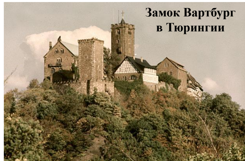
Замок Вартбург в Тюрингии