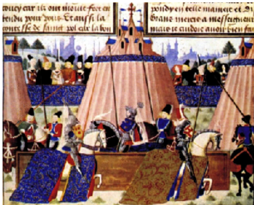
Турнир. Миниатюра из хроники Фруассара. Франция, конец XV в.