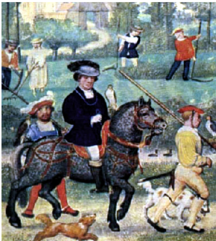
Соколиная охота. Миниатюра из фламандского календаря начала XVI в.

Любимыми занятиями рыцарей были охота и турниры – военные состязания в ловкости и силе. Вечерами в замках устраивались шумные пиры.