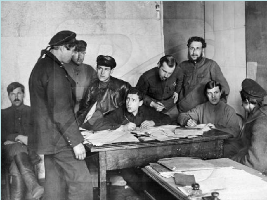
Воззвание Кронштадтского гарнизона