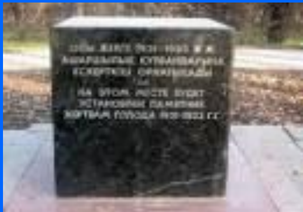
Ашаршылық құрбандарына ескерткіш орнына қойылған тақта. Алматы