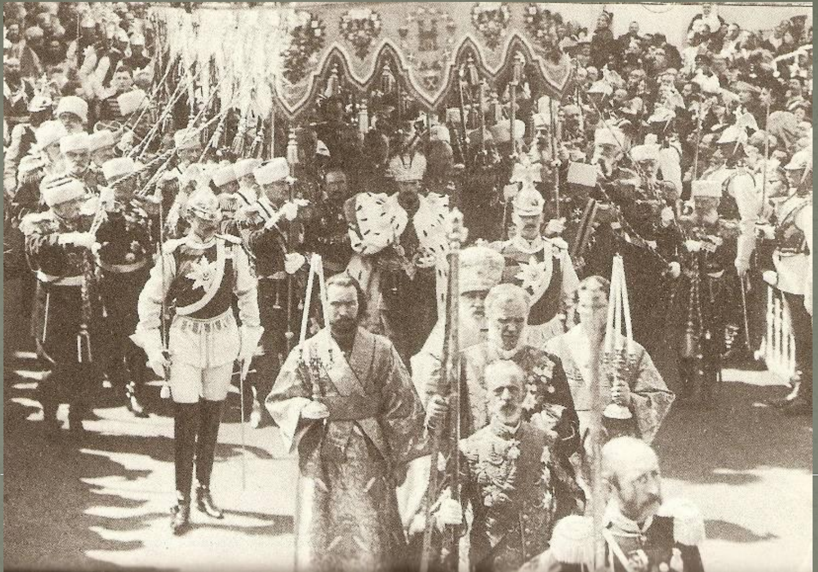
Коронация в Москве (1896 год).