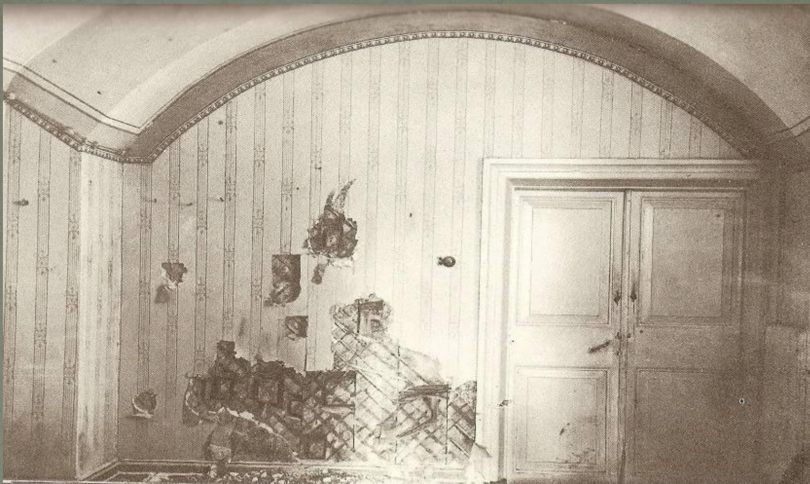
Полуподвальная комната в Ипатьевском доме, где была расстреляна Царская семья.