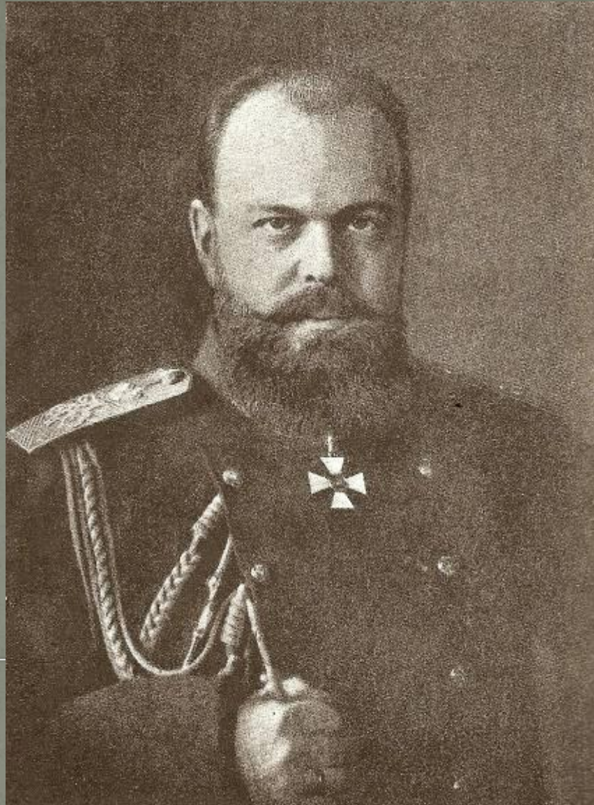
Александр III (1845-1894).