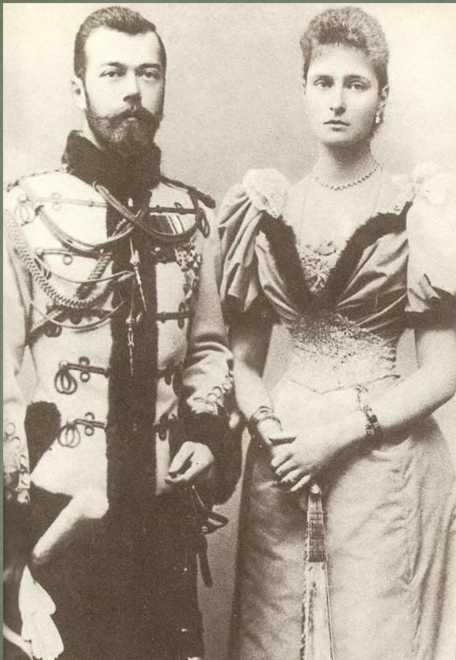
Николай Александрович и Александра Федоровна. 1896г.