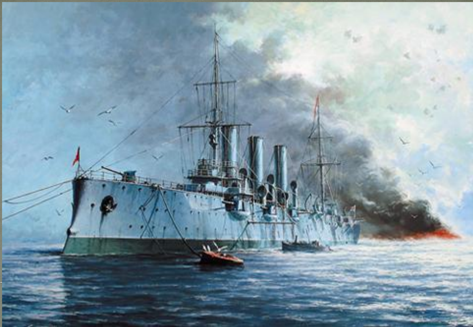
Цусимское морское сражение (май 1905 года)