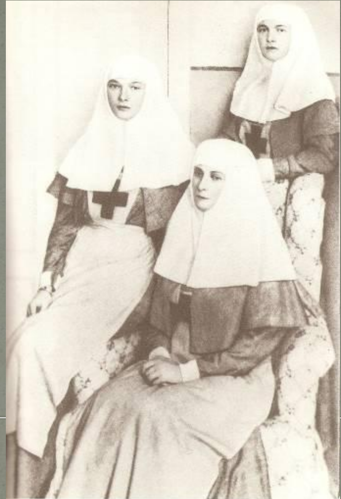
Сёстры милосердия. Императрица с дочерьми.