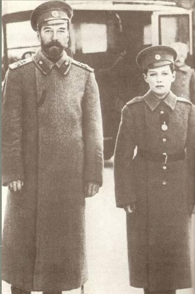
Отец и сын. Ставка. Могилёв.