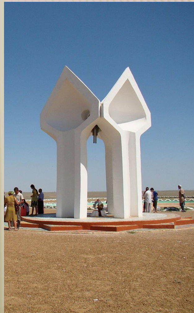
Қорқыт ата мемориалы

Қорқыт Ата ескерткіші – сәулет өнерінің айрықша үлгісі. Қызылорда облысы Қармақшы ауданы Жосалы кентінен 18 км жерде, Қорқыт станциясының түбінде (1980). Авторлары – Б.Ә. Ыбыраев, С.И. Исатаев. Қорқыт Ата ескерткіші темір бетоннан жасалған биіктігі 8 метр, 4 тік стеладан тұрады.