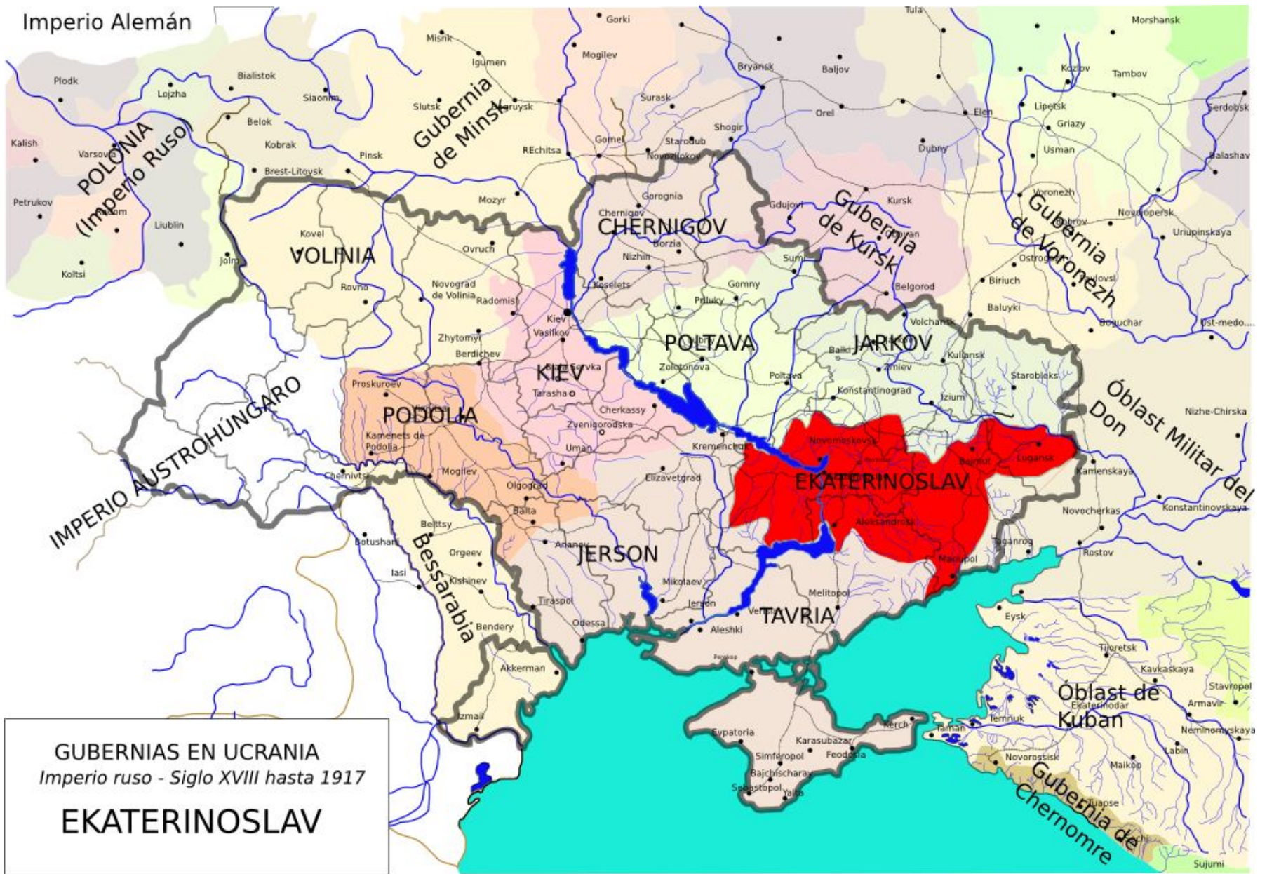
GUBERNIAS EN UCRANIA Imperio ruso - Siglo XVIII hasta 1917 EKATERINOSLAV