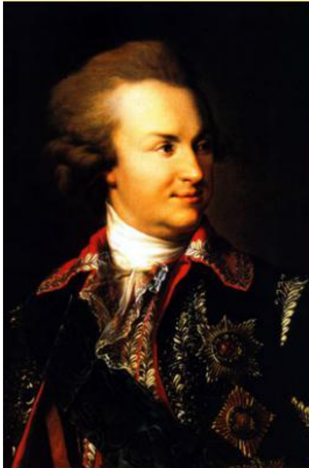
Князь Григорий Александрович Потемкин-Таврический.

Главную роль в переговорах с Шагин-Гиреем о присоединении Крыма главную роль сыграл фаворит Екатерины Г.А. Потемкин.