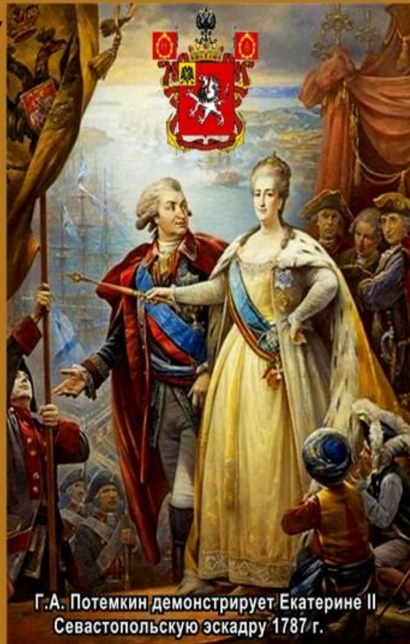
Г.А. Потемкин демонстрирует Екатерине II Севастопольскую эскадру 1787 г.