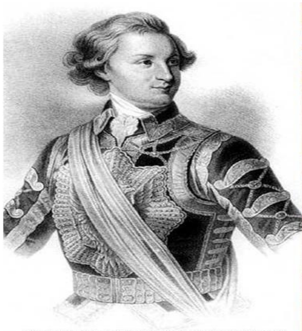
Князь Григорий Александрович Потемкин-Таврический

Князь Григорий Александрович Потемкин – Таврический, шеф Кавалергардского корпуса.