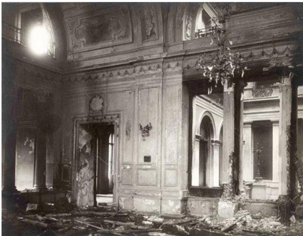
Столовая Зимнего дворца после взрыва.