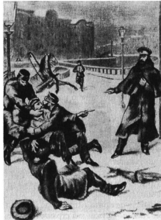
Покушение А. Соловьева.