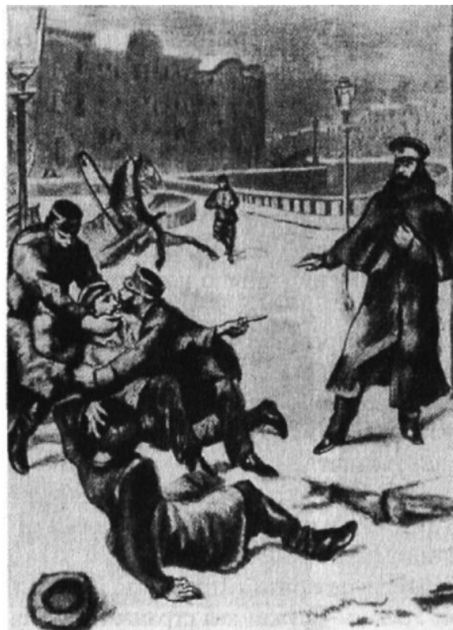
Покушение А. Соловьева.