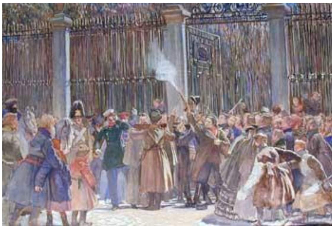
Покушение Д. Каракозова.