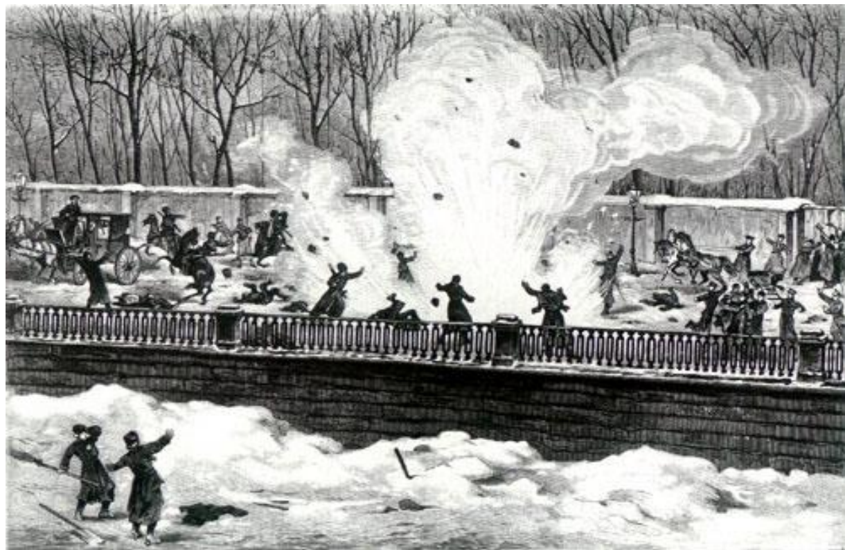
Взрыв первой бомбы Рысакова.