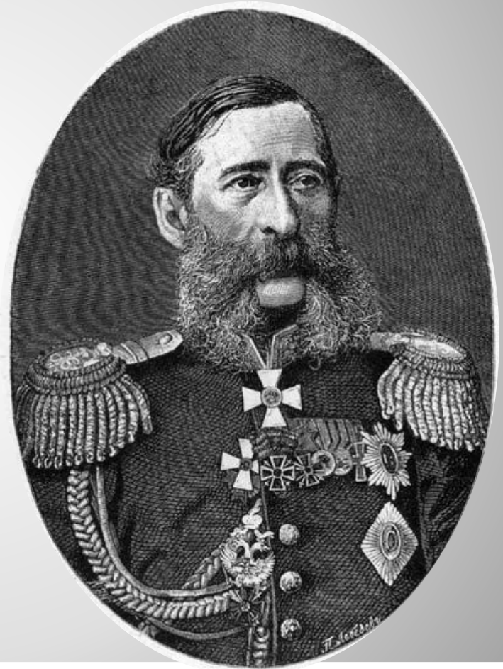
Генерал М. Т. Лорис-Меликов