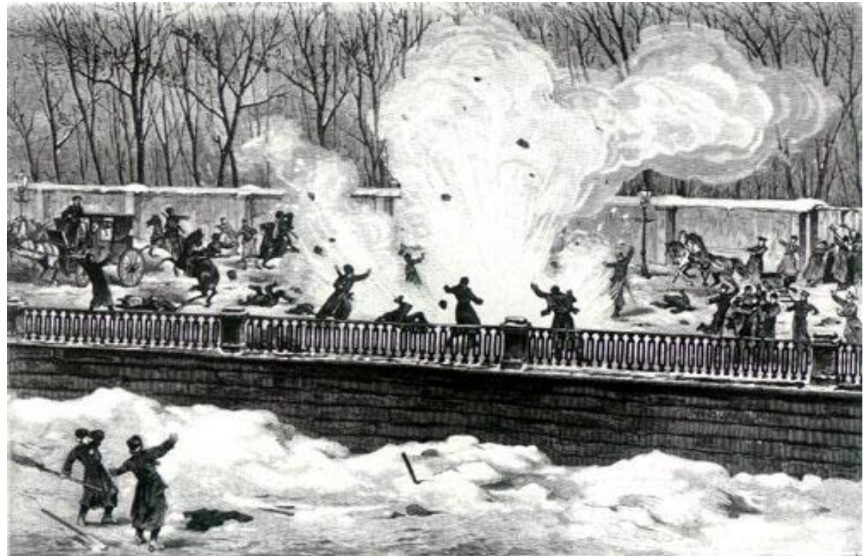
Взрыв первой бомбы Рысакова.