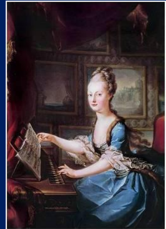
Мария-Антуанетта (1755 – 1793)