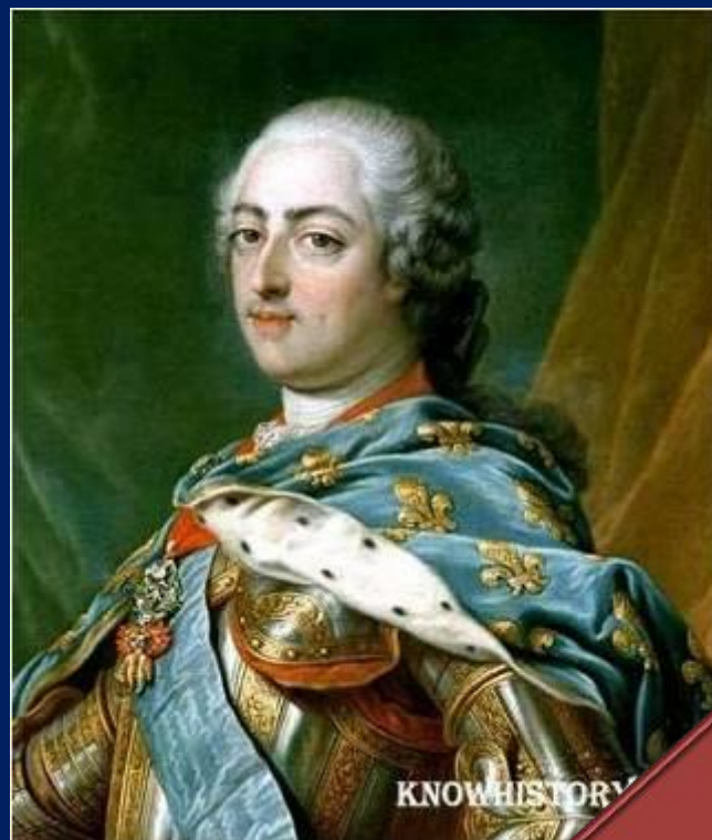
Людовик XV (1715 – 1774)

«Только в одной моей особе пребывает королевская власть. Весь общественный порядок во всем его объеме исходит от меня, интересы и права нации — все здесь, в моей руке.