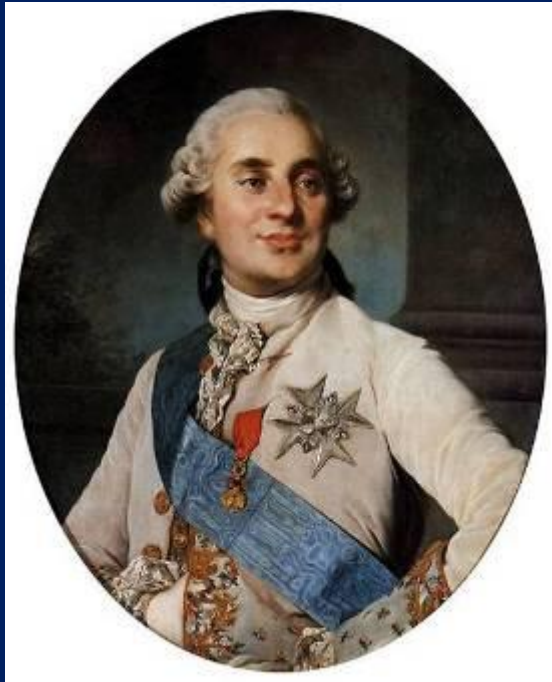
Людовик XVI (1754 – 1793)