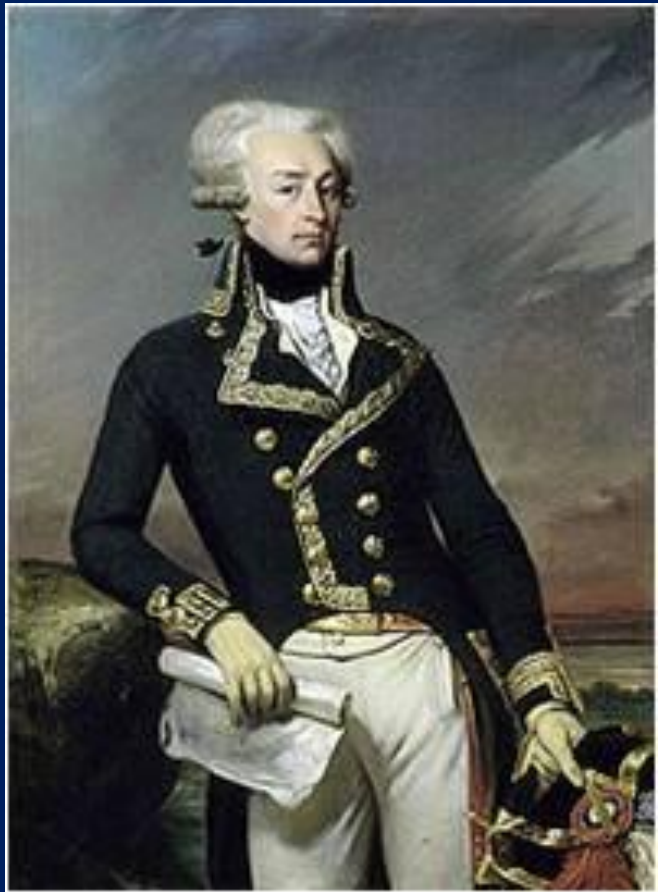
Жильбер де Лафайет

Революция распространялась по всей стране. В городах образовались выборные органы власти - муниципалитеты , создавалась вооруженная сила - Национальная гвардия .