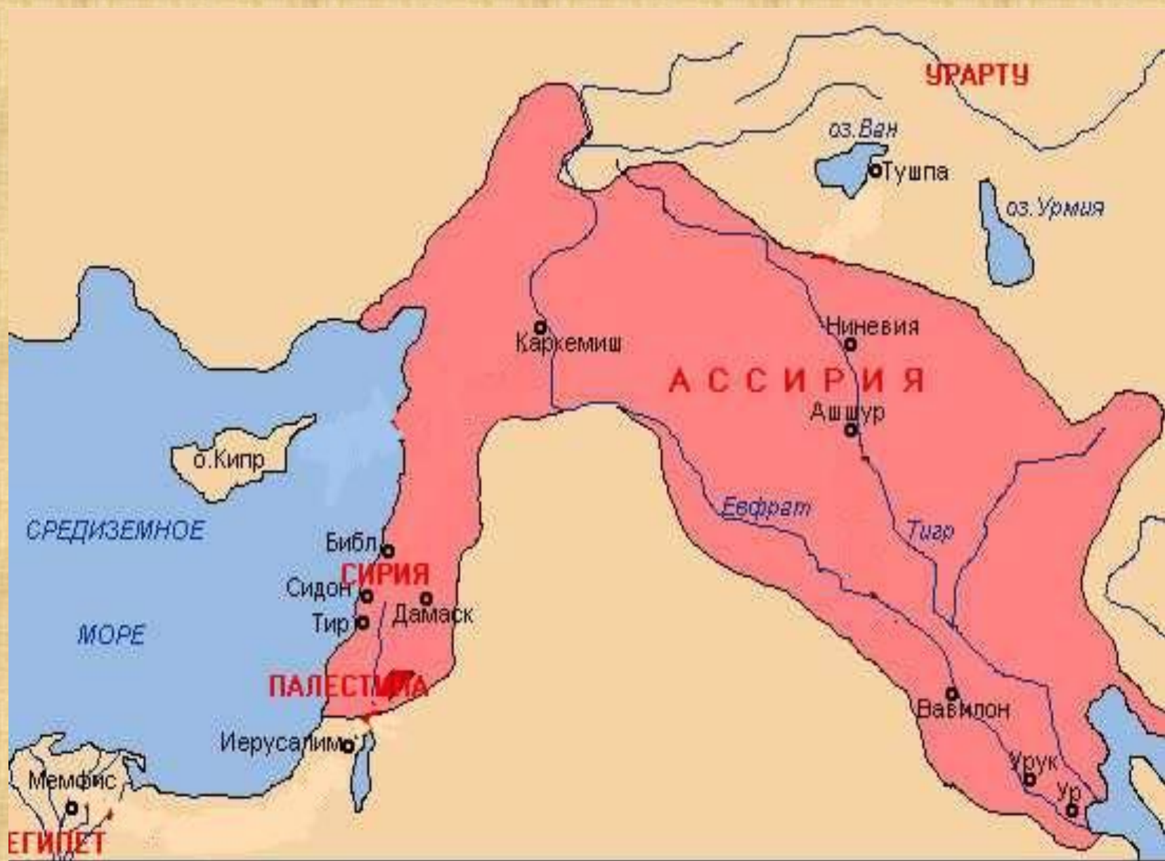
Территория ассирийской державы в середине VII века до н.э.