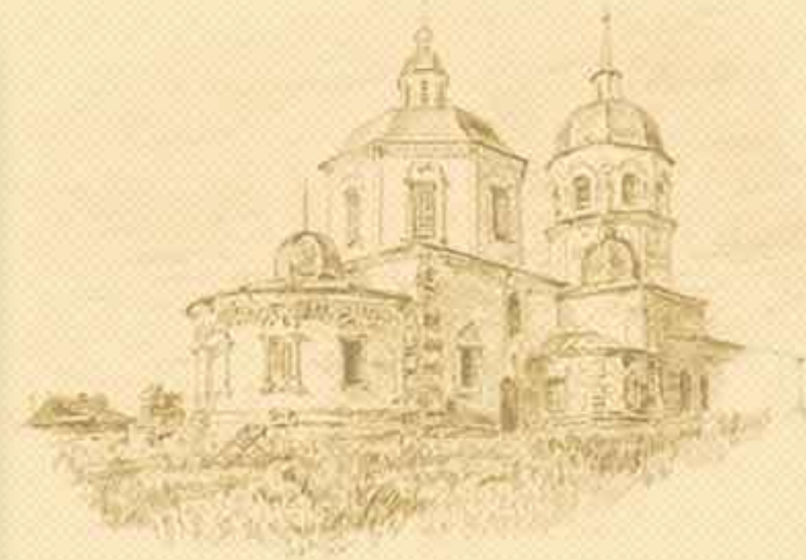
Храм Казанской иконы Божией Матери в селе Пески