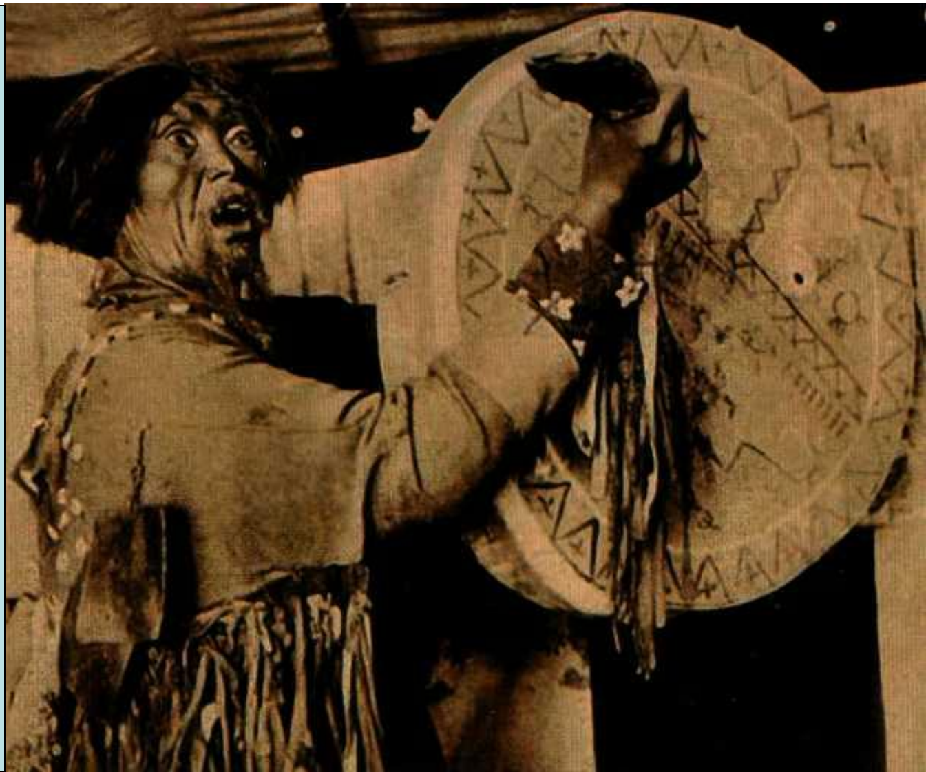
Фото 19 века