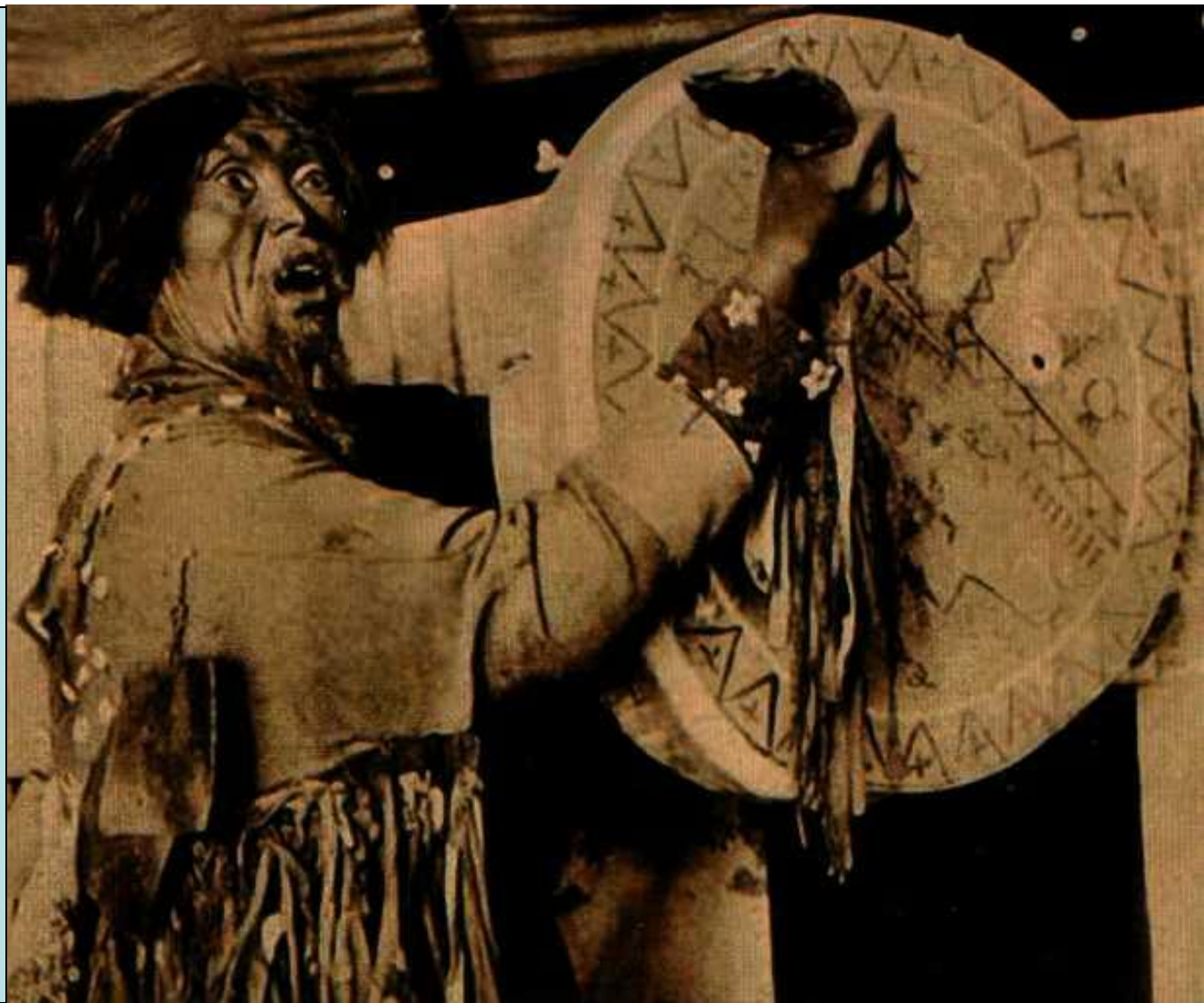
Фото 19 века