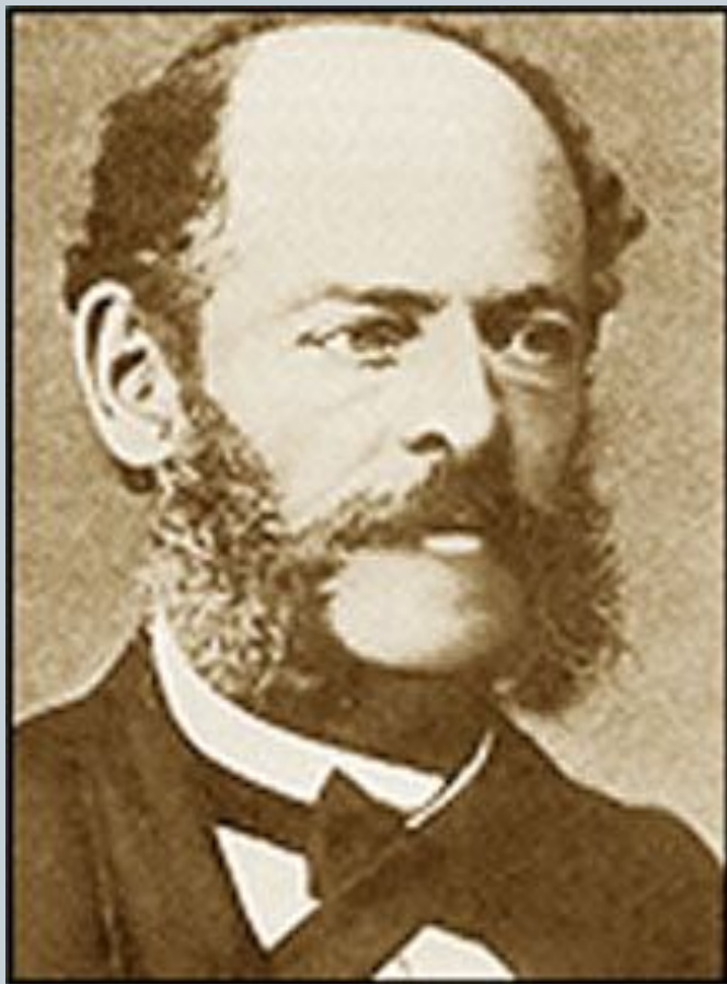
Марселино де Саутуола

Саутуола работал в одиночку, приходил в пещеру — и день за днем копал. (Археологи были тогда еще одиночками — первопроходцами своей науки). Хотя археолог не был совсем один: он брал с собой дочку, Марию. Девочке полезна прогулка в горы, а пока отец работал, ей нравилось ходить по пещере и рассматривать ее. И вот однажды он услышал ее звонкий возглас: «Папа, смотри, нарисованные быки!» Оторвавшись от земли, папа поднял усталые глаза — и замер от удивления, не зная, что и подумать. Действительно, быки.