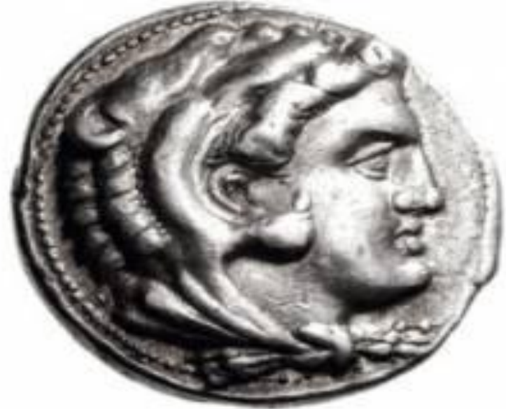
Портреты Александра Великого на монетах, выпущенные при его жизни