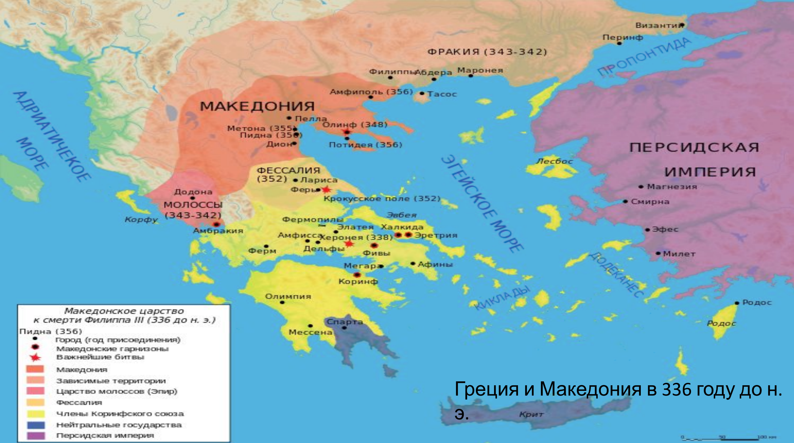
Греция и Македония в 336 году до н. э.