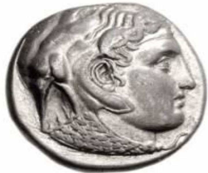
Портреты Александра Великого на монетах, выпущенные после его смерти