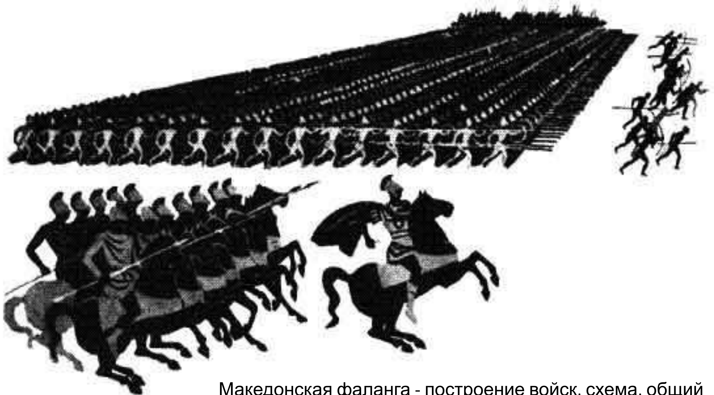
Македонская фаланга - построение войск, схема, общий вид