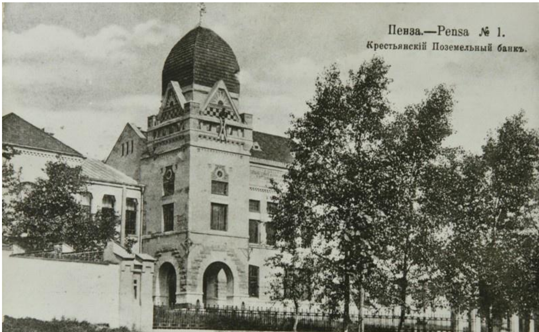
Пенза.—Pensa № 1. Крестьянскій Поземельный банкъ.