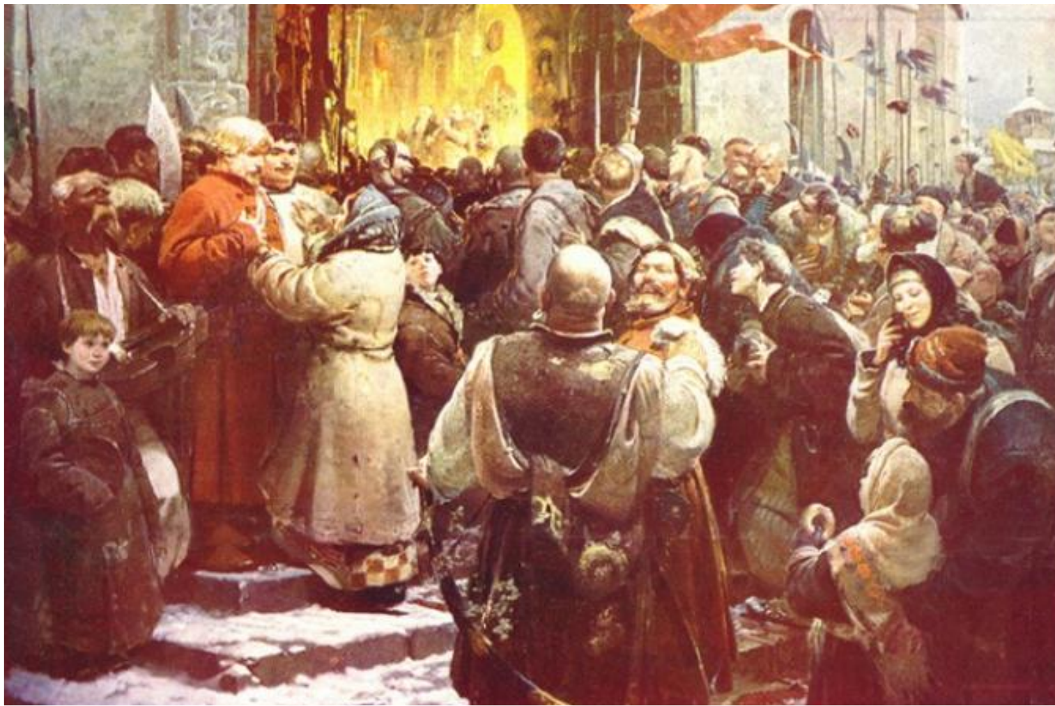
Восстание в Москве в 1547г.