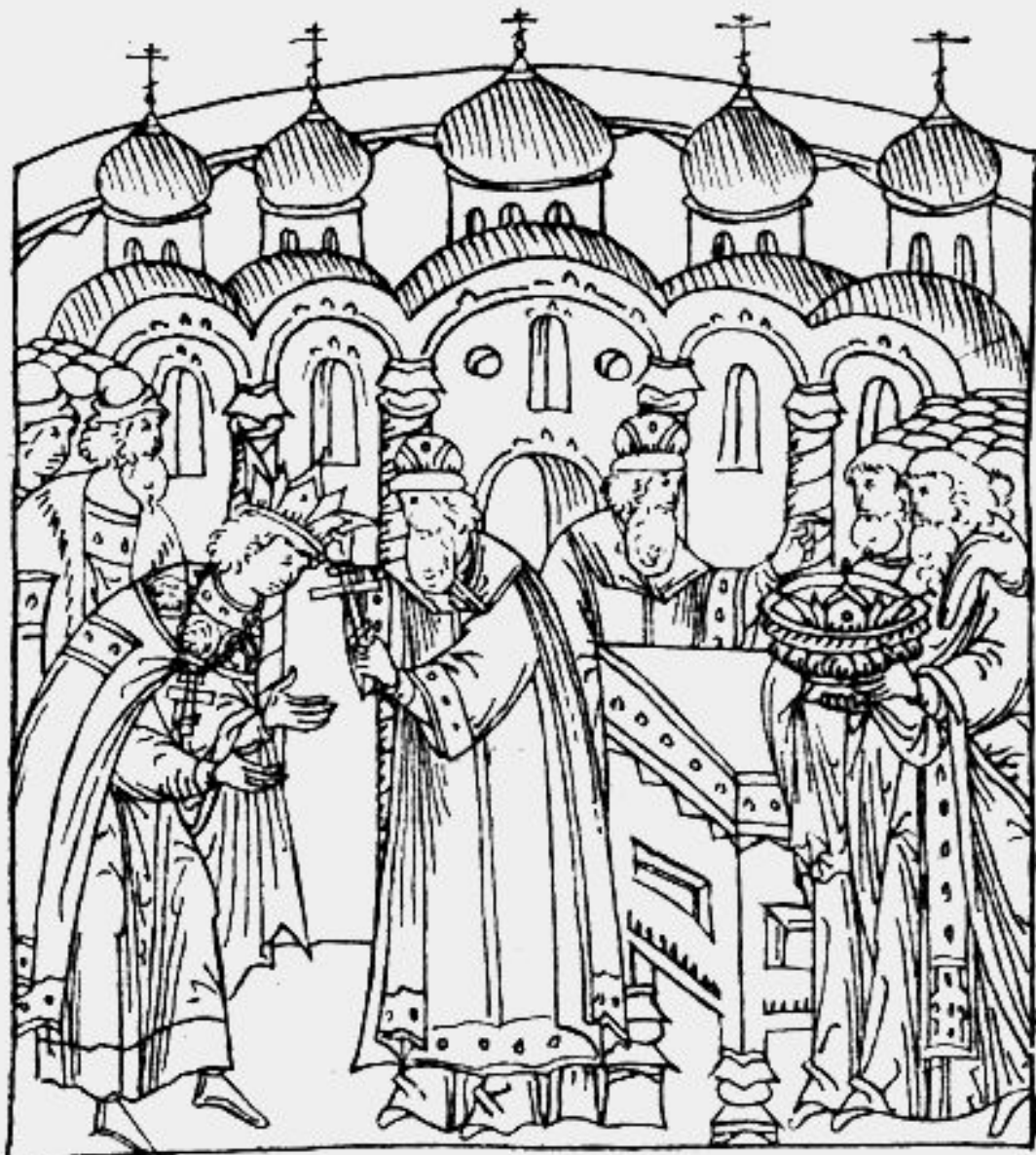
Коронация Ивана Грозного. Фотографическая репродукция