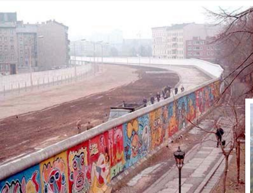
Берлинская стена 1961р.