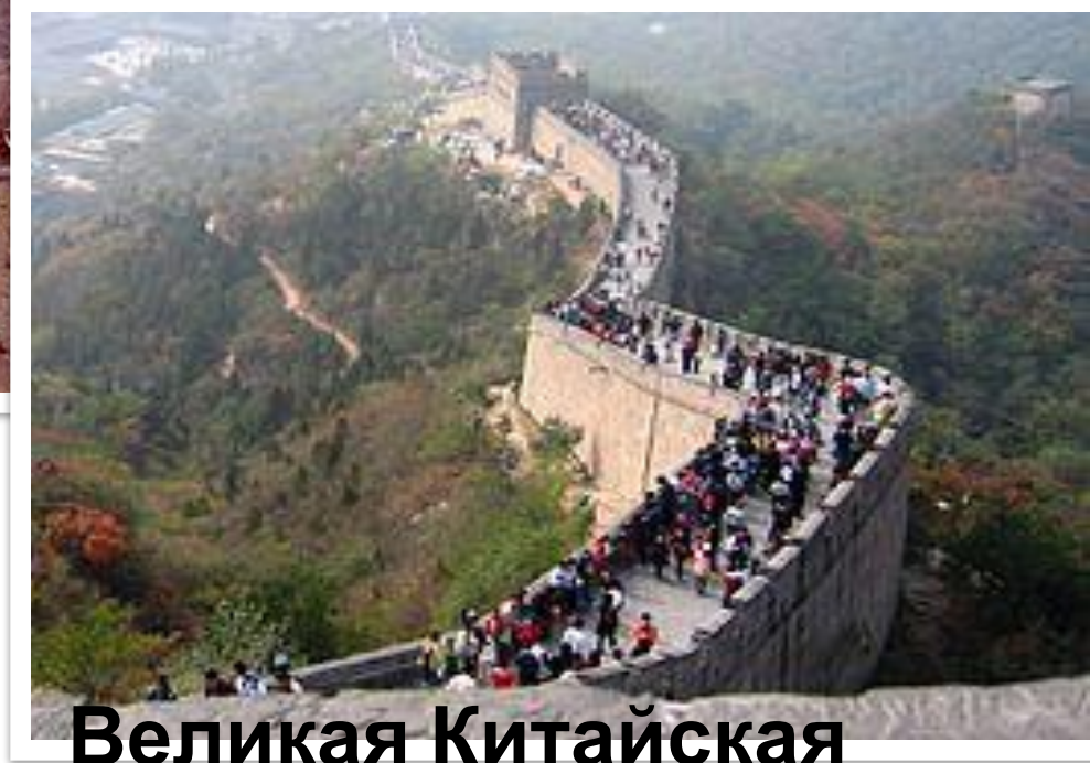
Великая Китайская стена