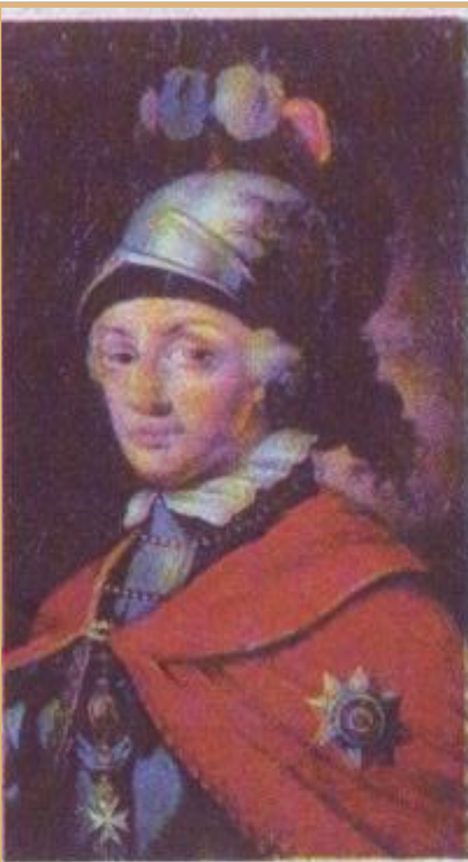
А. В. Суворов.