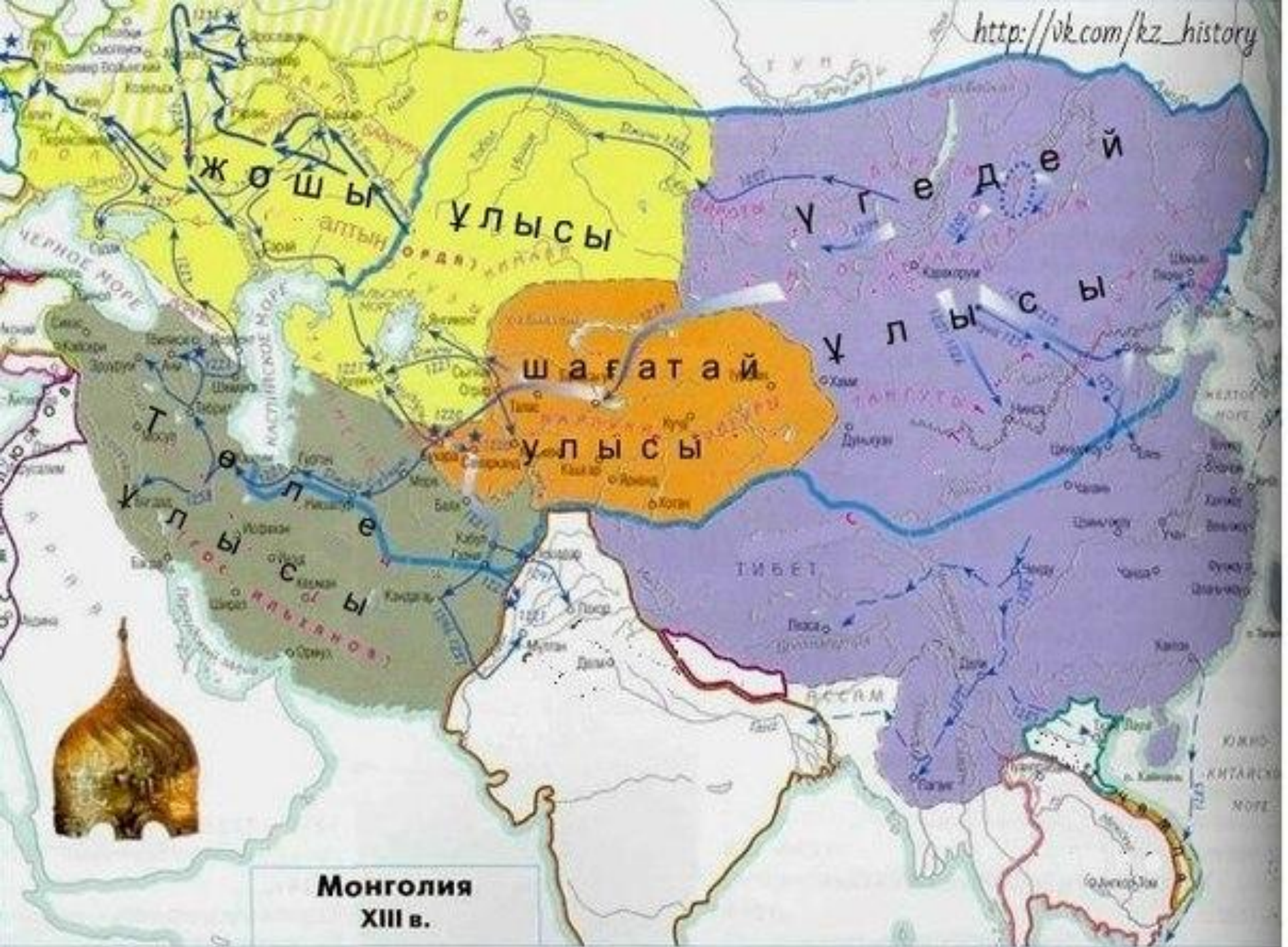
Монголия XIII в.