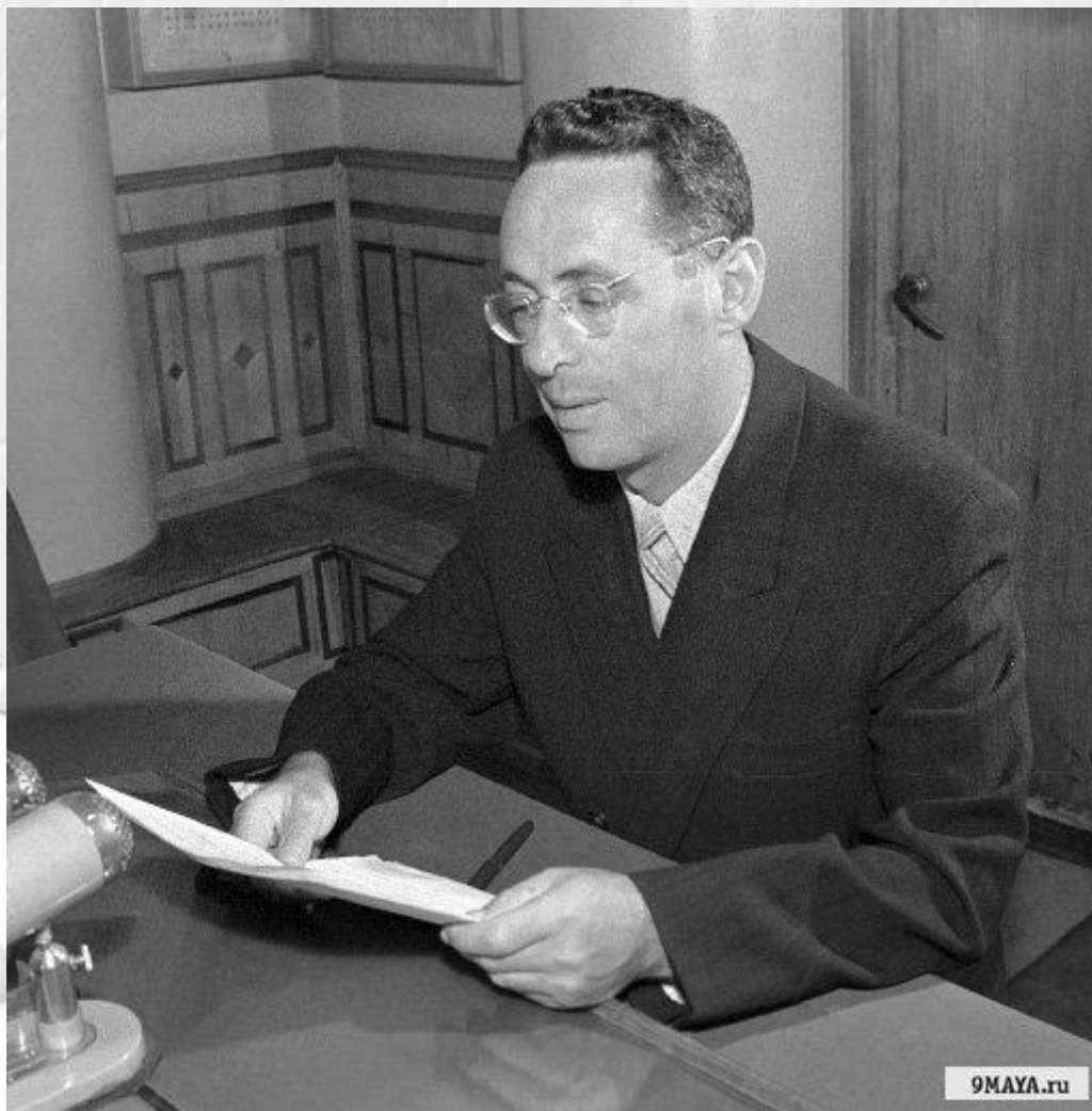
Ю. Б. Левитан