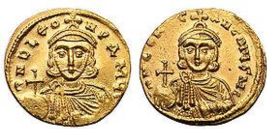
Лев III и его сын Константин V