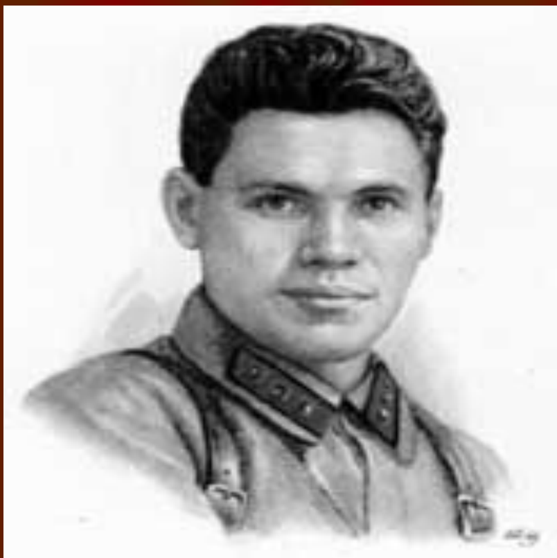
политрук 4 роты Клочков Василий Георгиевич 8 марта 1911 года - 16 ноября 1941 года