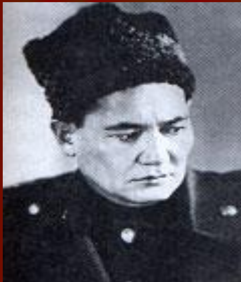
Бауржан Момышулы – Герой Советского Союза (1910-1982)