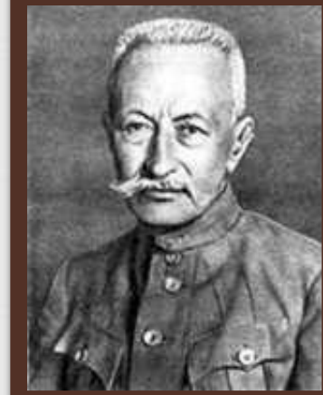
Генерал Олексій Брусилов (1853-1926)