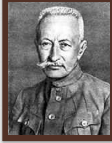
Генерал Олексій Брусилів (1853-1926)