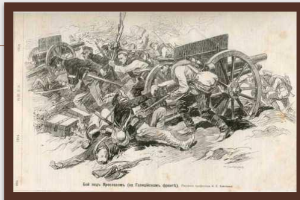
«Бій під Ярославом, Галицький фронт» восени 1914 р.

Російські війська захопили Східну Галичину та Північну Буковину. Було створено генерал-губернаторство «Галицько-Буковинське», на чолі граф Бобринський.