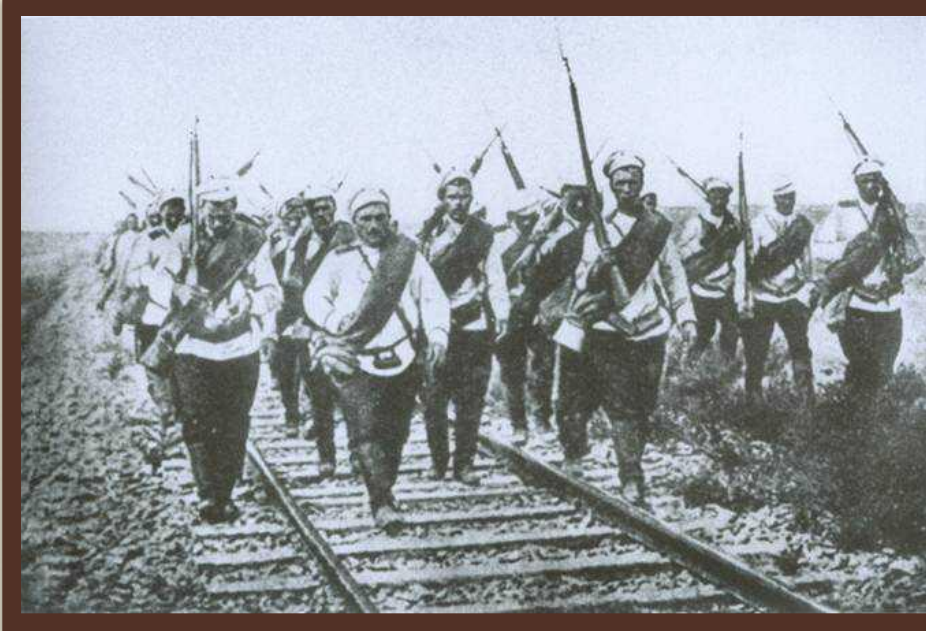
«Росіяни в Галичині» 1916 р.