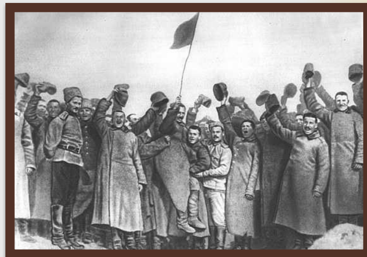
«Вихід Росії з війни»

Поразка Росії, вона втратила Західні землі України, вийшла з війни.