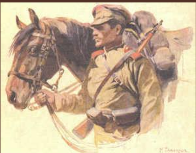
«У Галичині. Кавалерист» восени 1914 р.