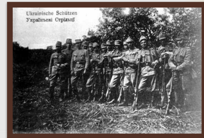
«Легіон Українських січових стрільців» 1914 р.