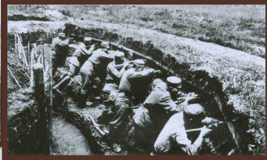
«У боях за Галичину» 1916 р.