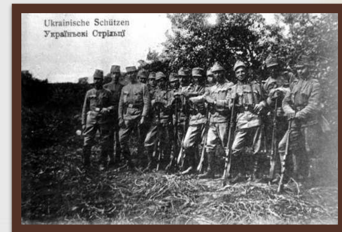
«Легіон Українських січових стрільців» 1914 р.