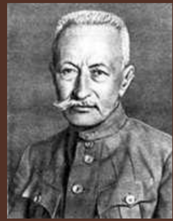
Генерал Олексій Брусилов (1853-1926)