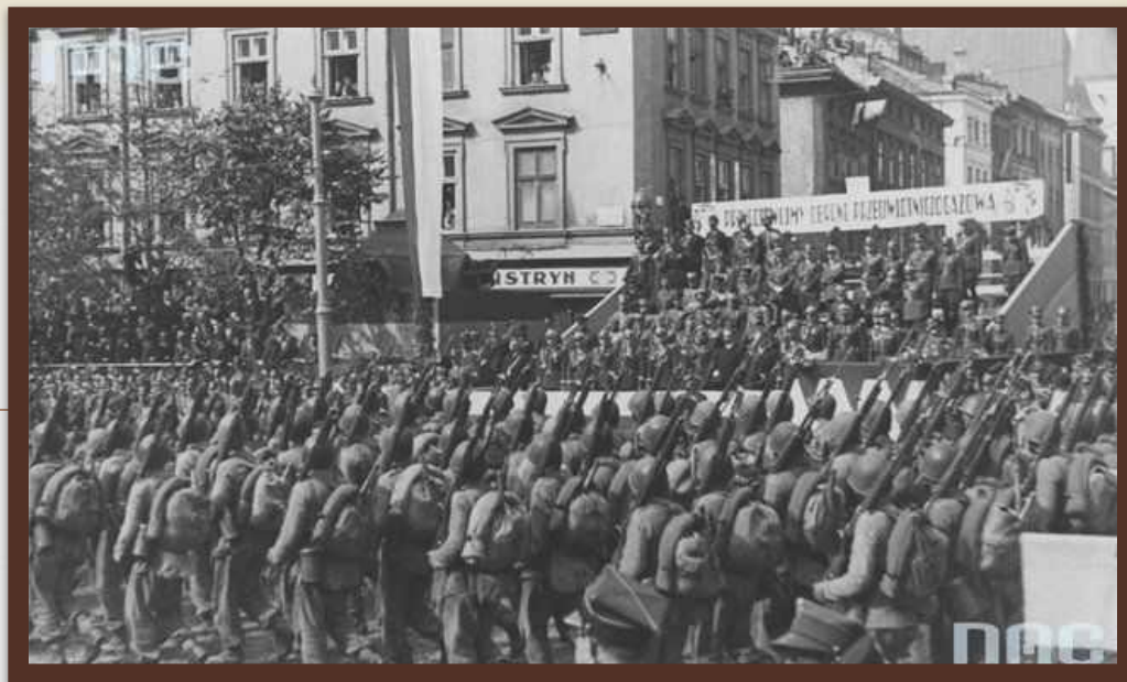
«Австро-німецькі війська окупували Львів» 1915 р.