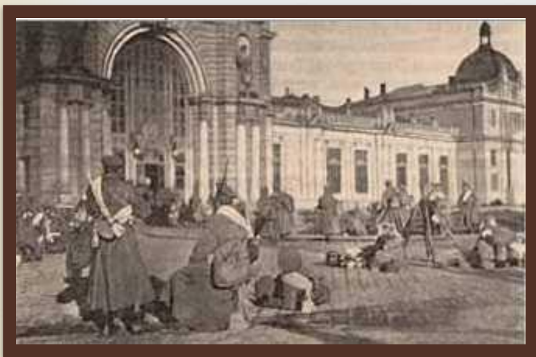
«Російські війська у Львові та Бучачі» 1915 р.