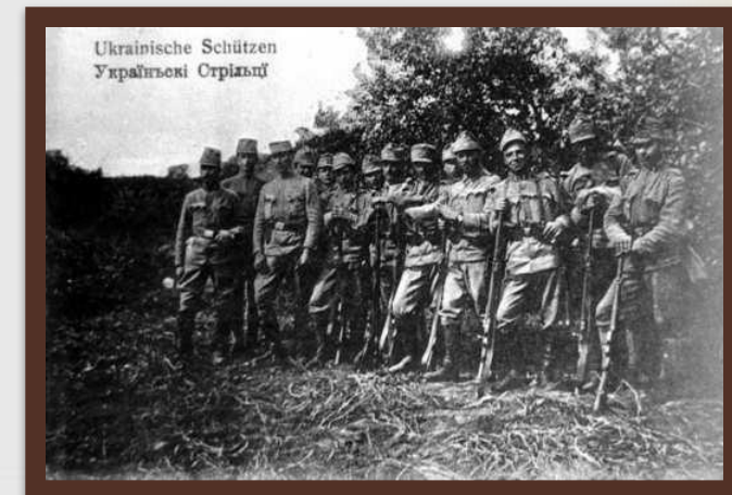
«Легіон Українських січових стрільців» 1914 р.