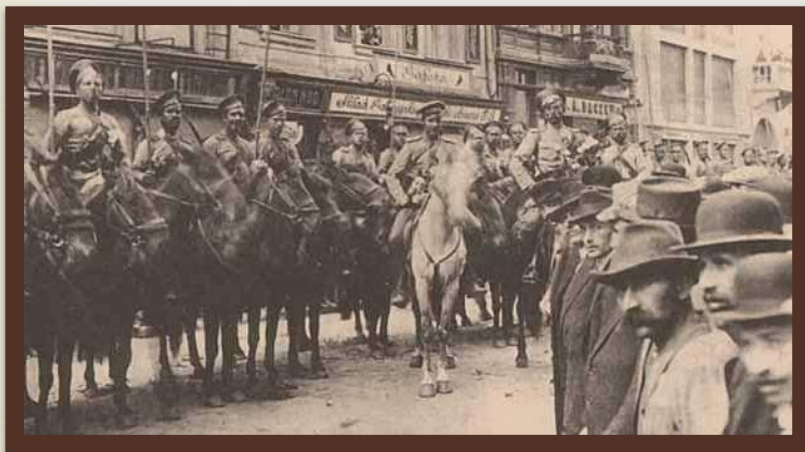
«Російський військовий патруль у Львові» 1915 р.