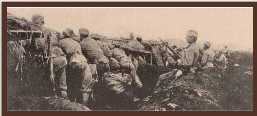
Січові стрільці в окопах під Галичем. 1915 р.