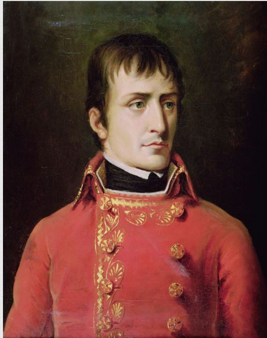
Первый консул Наполеон