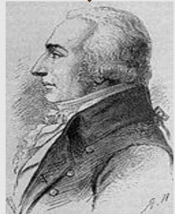
Третий консул Роже Дюко