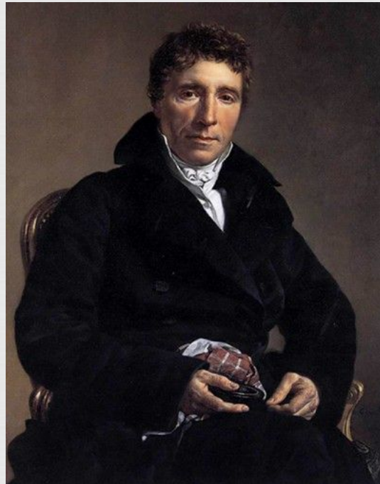
Второй консул Эммануэль – Жозеф Сийес