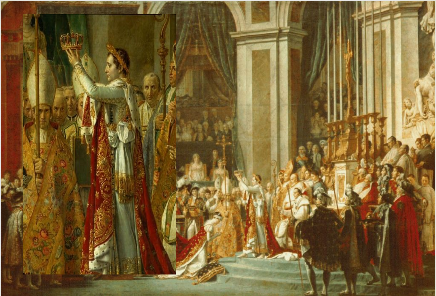
Посвящение императора Наполеона I и коронование императрицы Жозефины в соборе Парижской