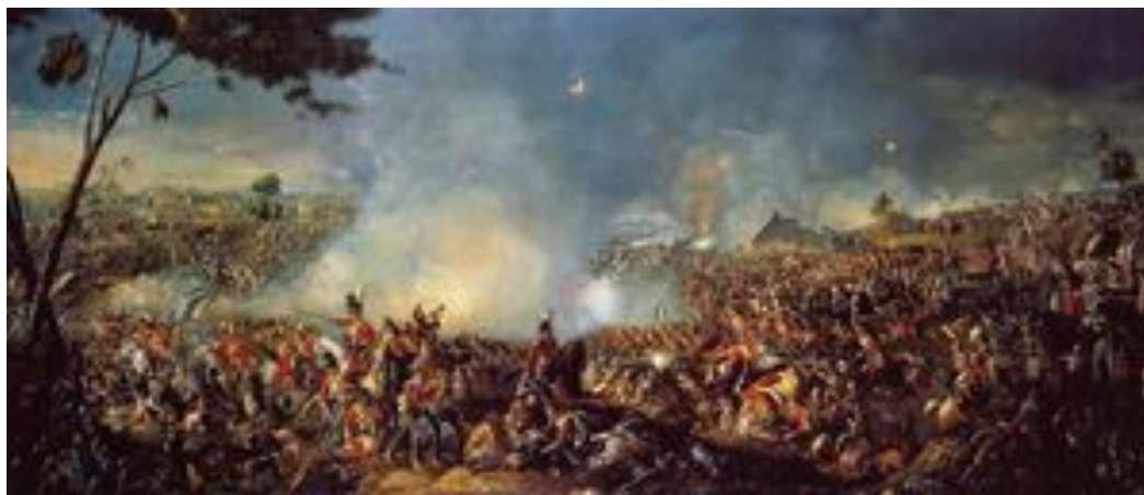
Вильям Сэдлер, «Битва при Ватерлоо»

Наполеон был сослан во второй раз, но уже на остров Эльба в Средиземном море. Власть Бурбонов во Франции была восстановлена.