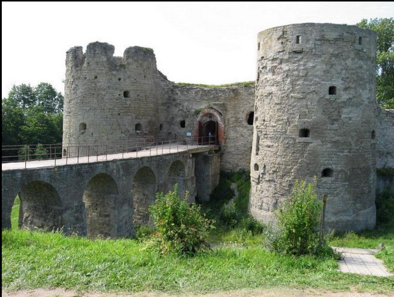
Крепость, мемориал ВОВ (Ораниенбаумского плацдарма)