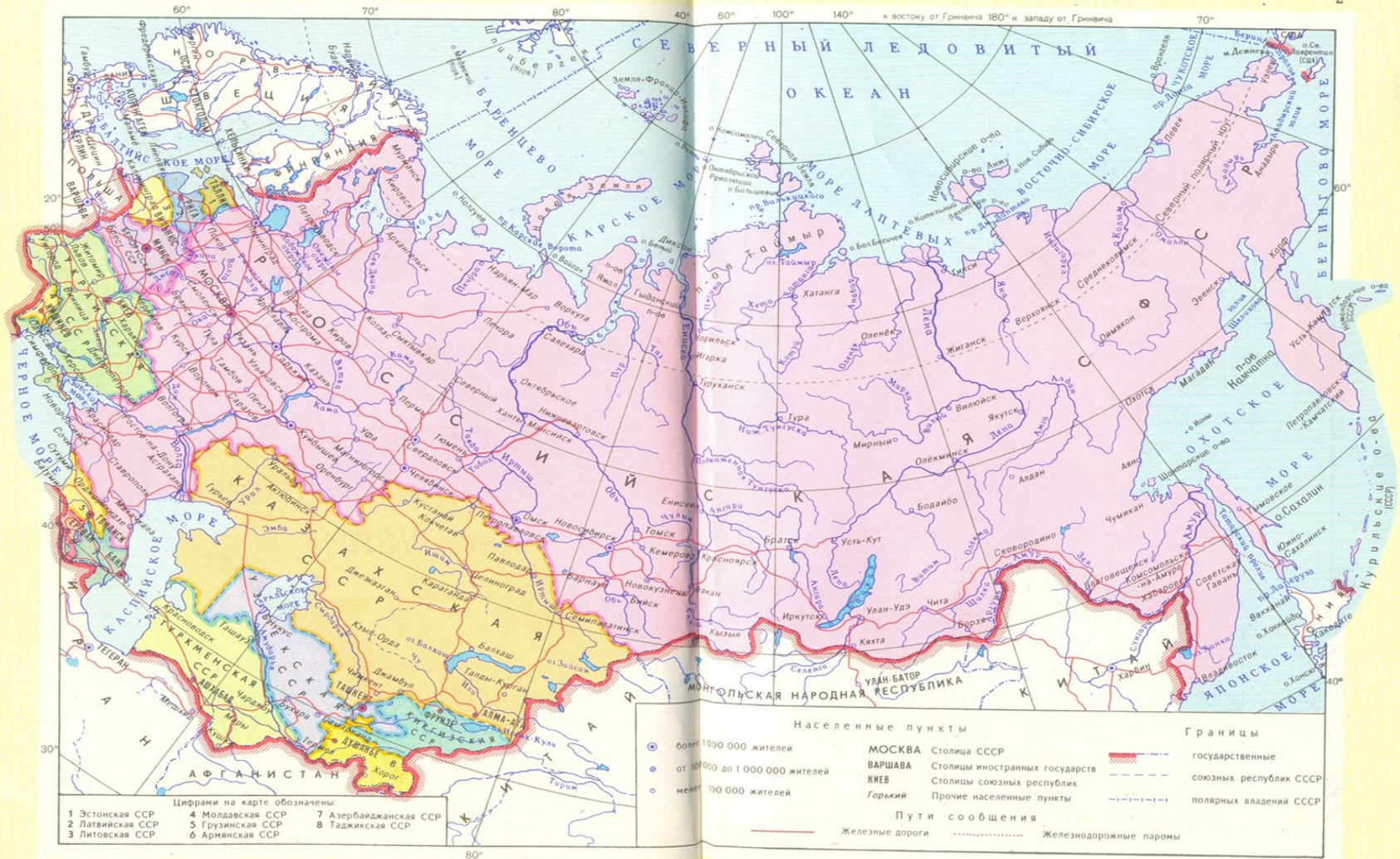
Масштаб 1:35 000 000