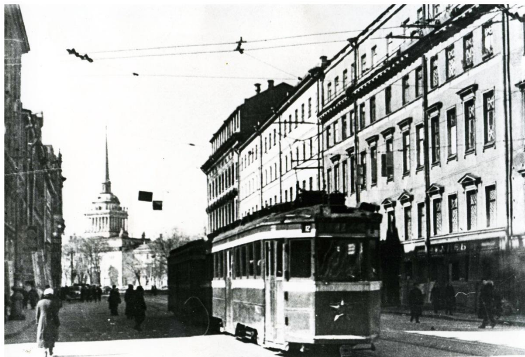
Первые трамваи на пр. 25-го Октября после восстановления трамвайного движения. 15.04.1942 г.

«После зимы 1941-42 гг. жить стало немного легче, люди уже не умирали прямо на улицах города...в городе заработал общественный транспорт»