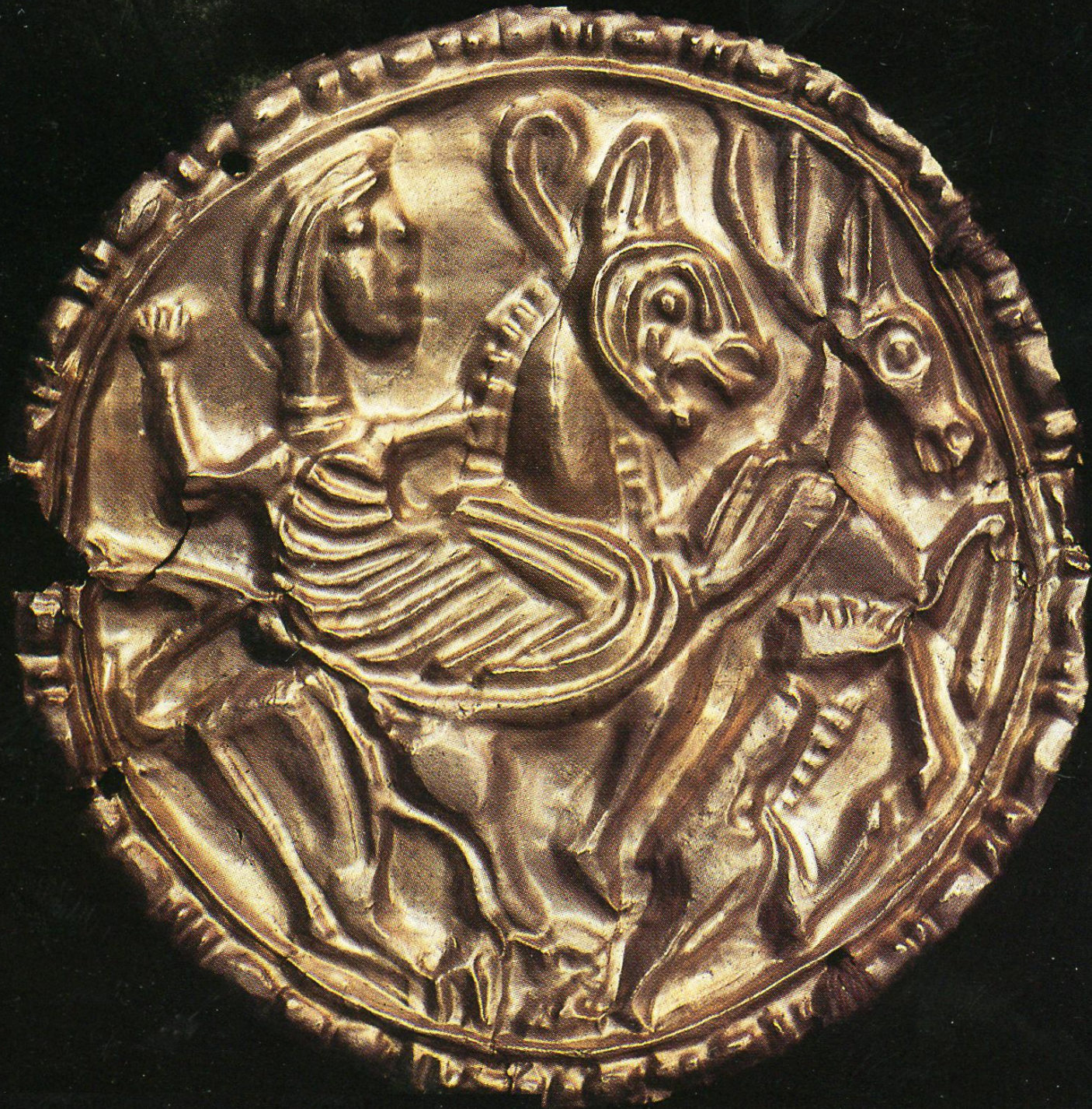
Золотая нашивная бляшка. Курган 1 у с. Дуровка