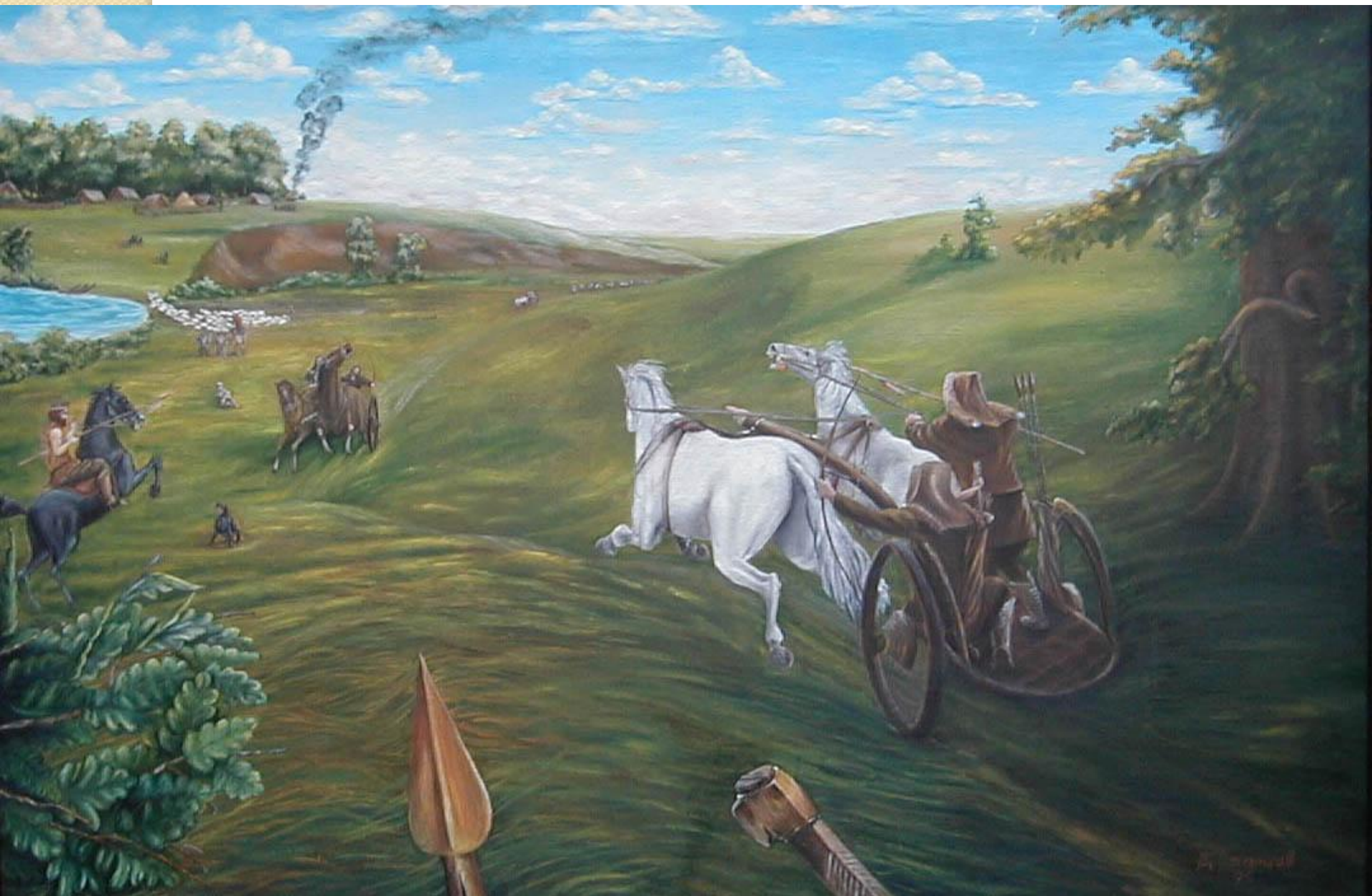
Реконструкция исторической ситуации в районе Мосоловского поселка (автор В.М. Старцев)