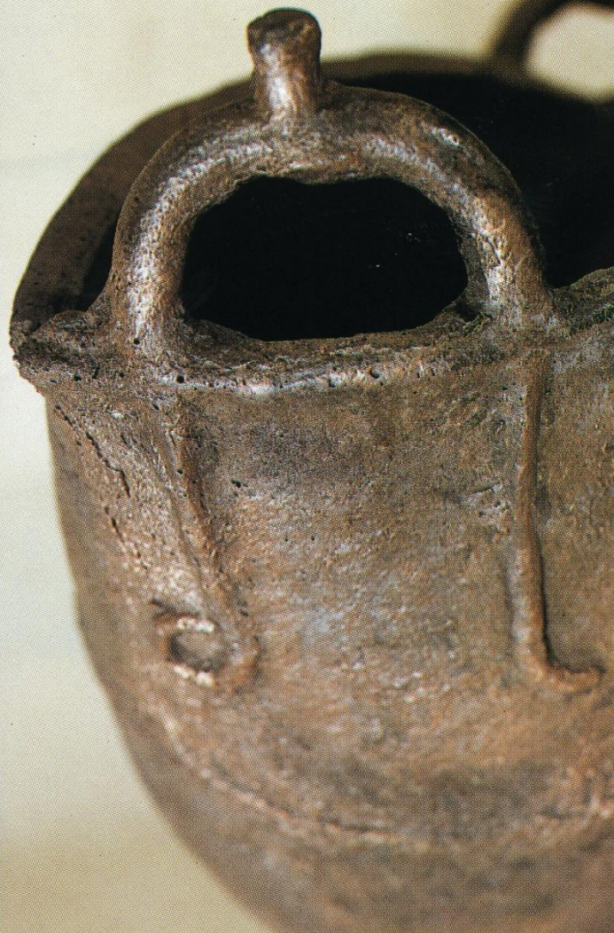
Бронзовый котел на полрой ножке. Курган 20 у с. Дуровка