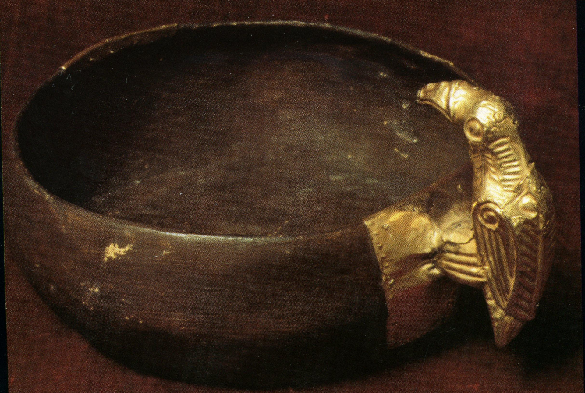
Чаша деревянная. Реконструкция из папье-маше. Курган 11 группы Частых.