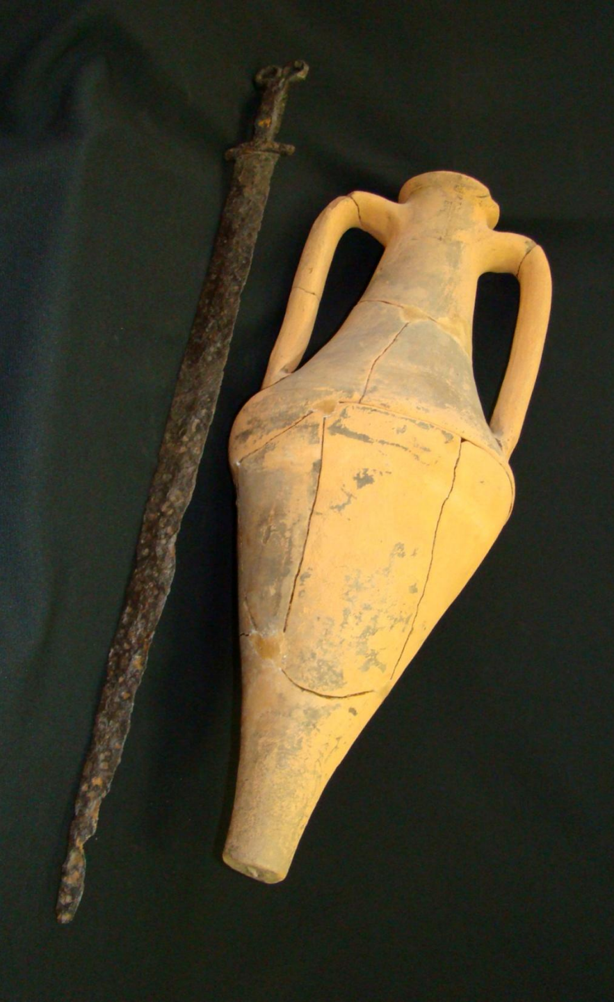
Меч и амфора скифского времени