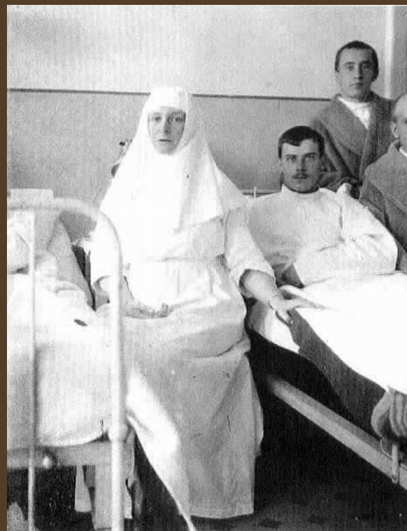
Императрица с солдатами. Царское Село, 1915