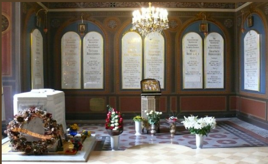
Гробница Императорской Семьи

Захоронение останков Императорской Семьи 17 июля 1998 года.