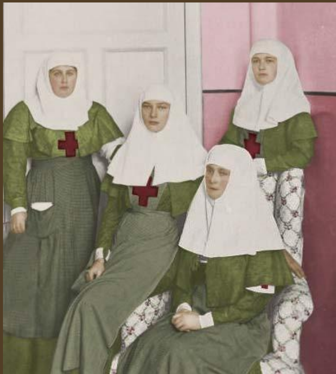
Императрица Александра Федоровна с дочерьми Татьяной и Ольгой и Анной Вырубовой