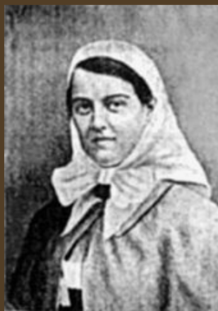
Великая княгиня Мария Павловна Младшая