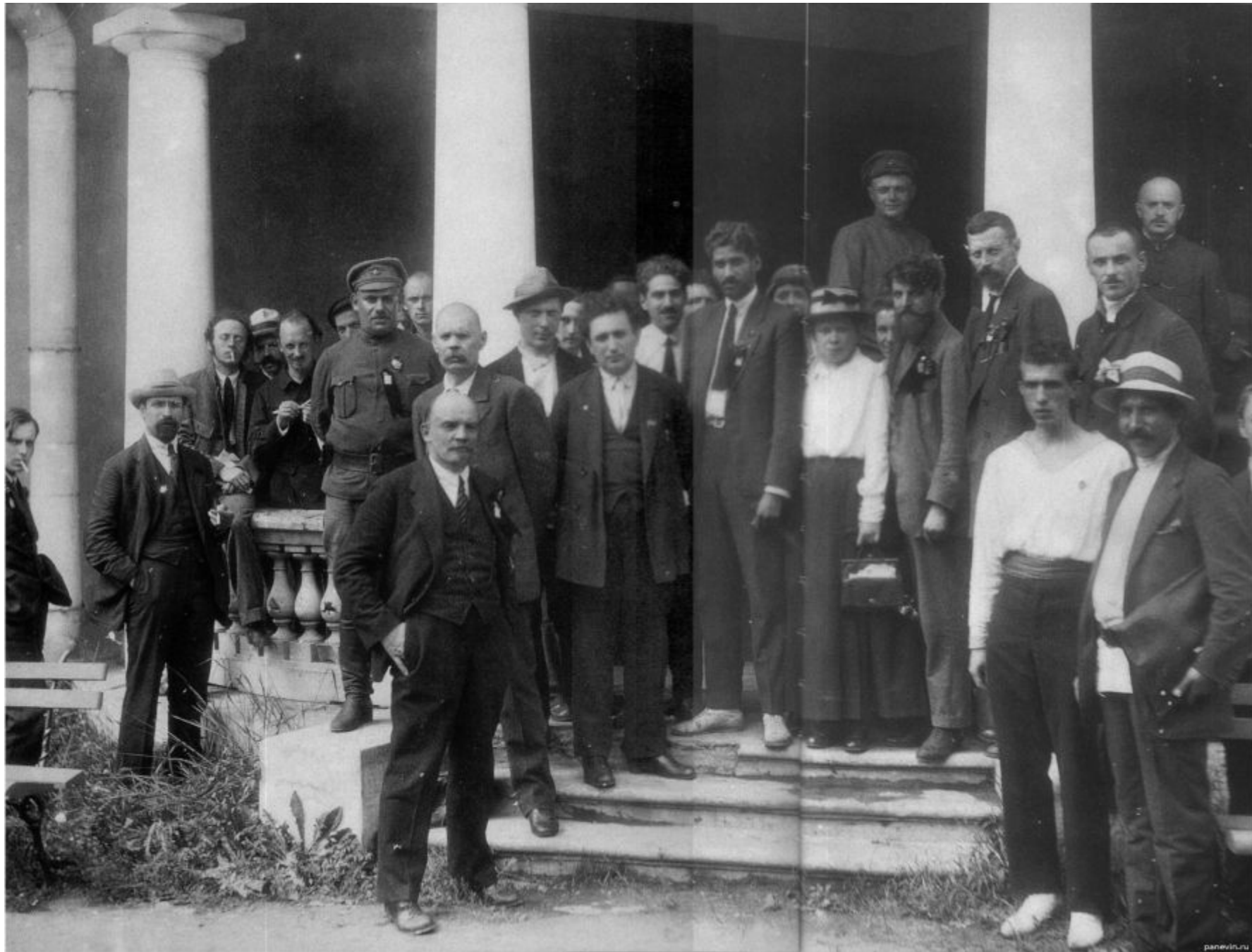
В.И.Ленин среди делегатов 2-го Конгресса Коминтерна в Петрограде