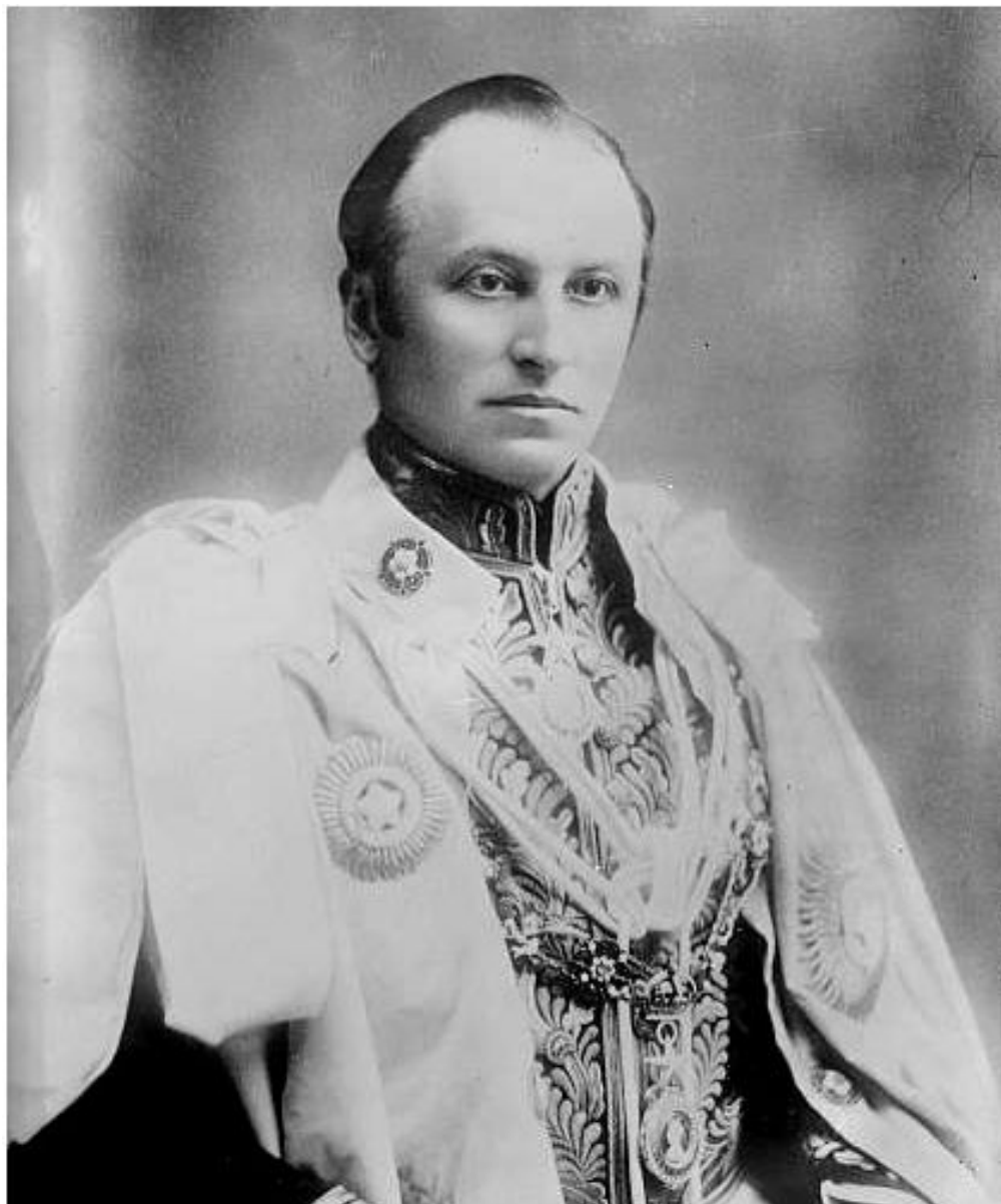
Керзон, Джордж Натаниэл 47-й Министр иностранных дел Великобритании

8 мая 1923 г. министр иностраннных дел Великобритании лорд Д. Керзон предъявил СССР обвинения в проведении антибританской политики на Востоке и в ультимативной форме потребовал в 10-дневный срок выполнения условий