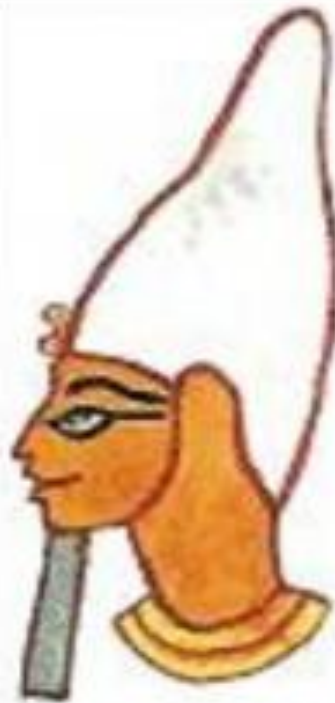
Белая корона правителя Верхнего Египта