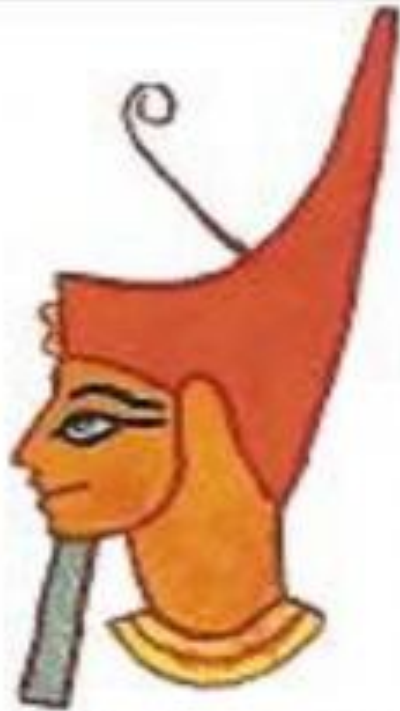
Красная корона правителя Нижнего Египта