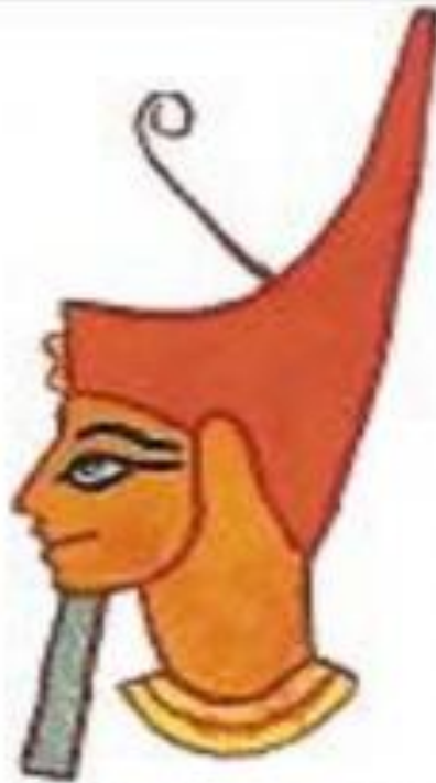
Красная корона правителя Нижнего Египта