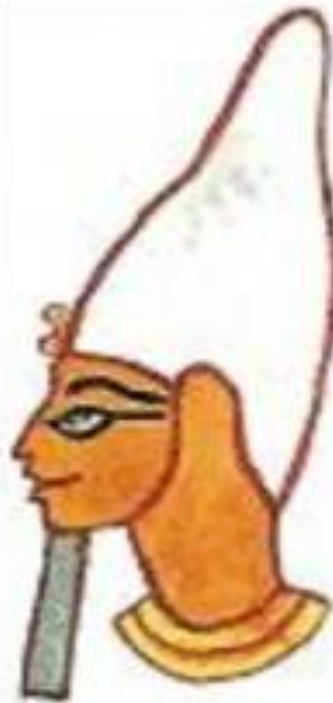
Белая корона правителя Верхнего Египта