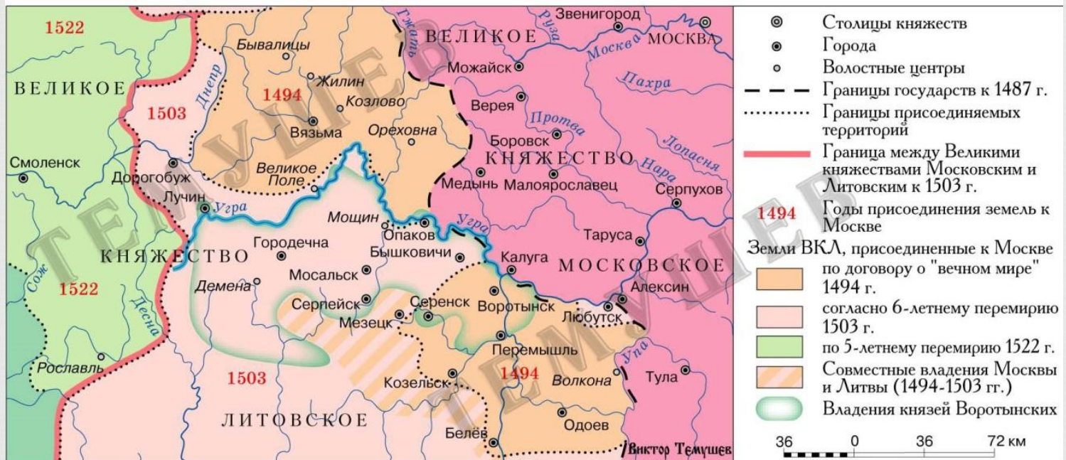
Карта 3 . Район реки Угры в конце XV – начале XVI в.