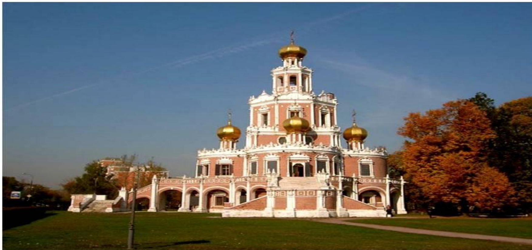
Церковь Покрова Пресвятой Богородицы в Филях. Москва.