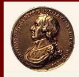
Монета с изображением Кромвеля