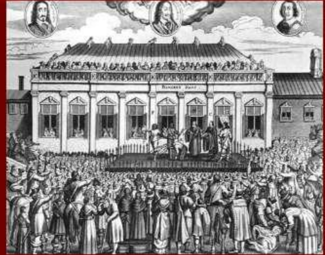
Казнь Карла I

Май 1649г. - Англия объявлена республикой. Был создан исполнительный орган Государственный совет во главе с Кромвелем