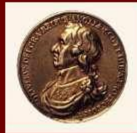
Монета с изображением Кромвеля