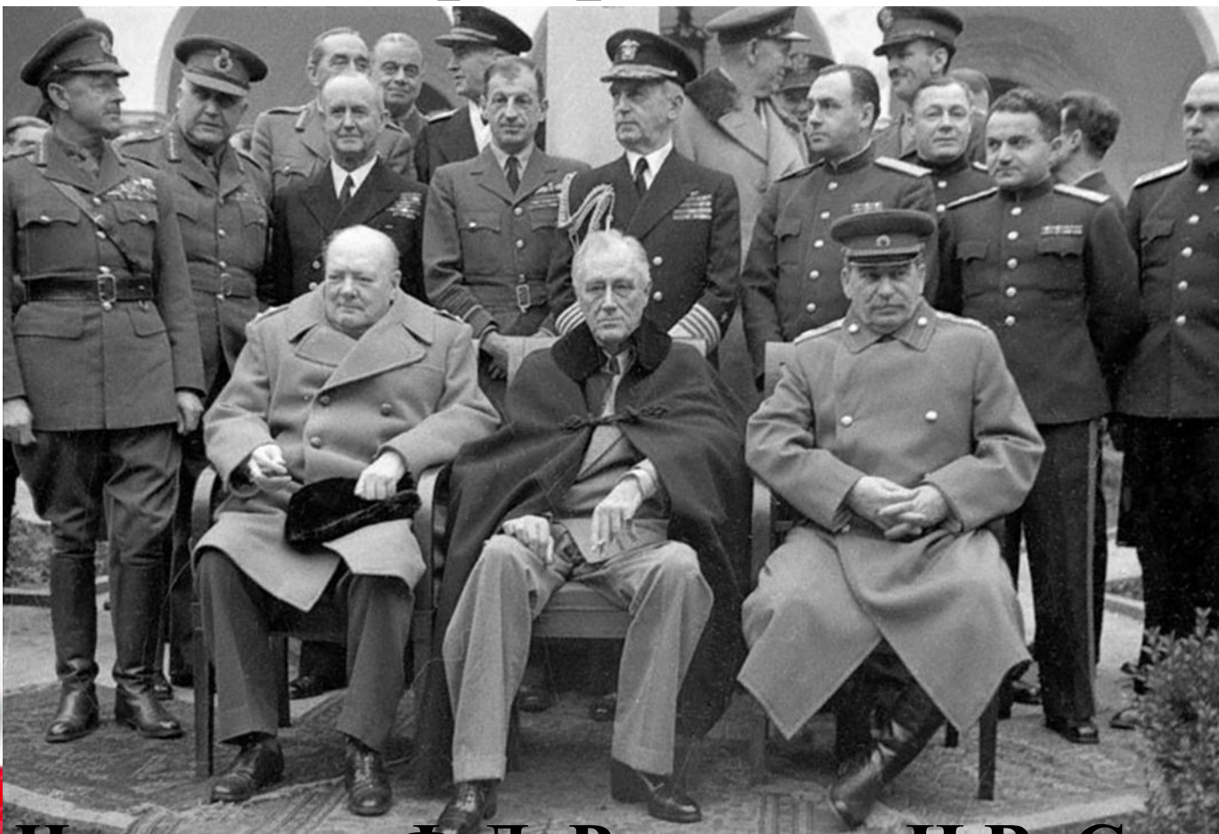
У. Черчилль, Ф.Д. Рузвельт, И.В. Сталин