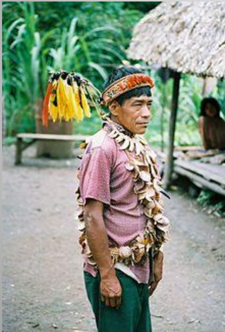
Шаман, 1988 год