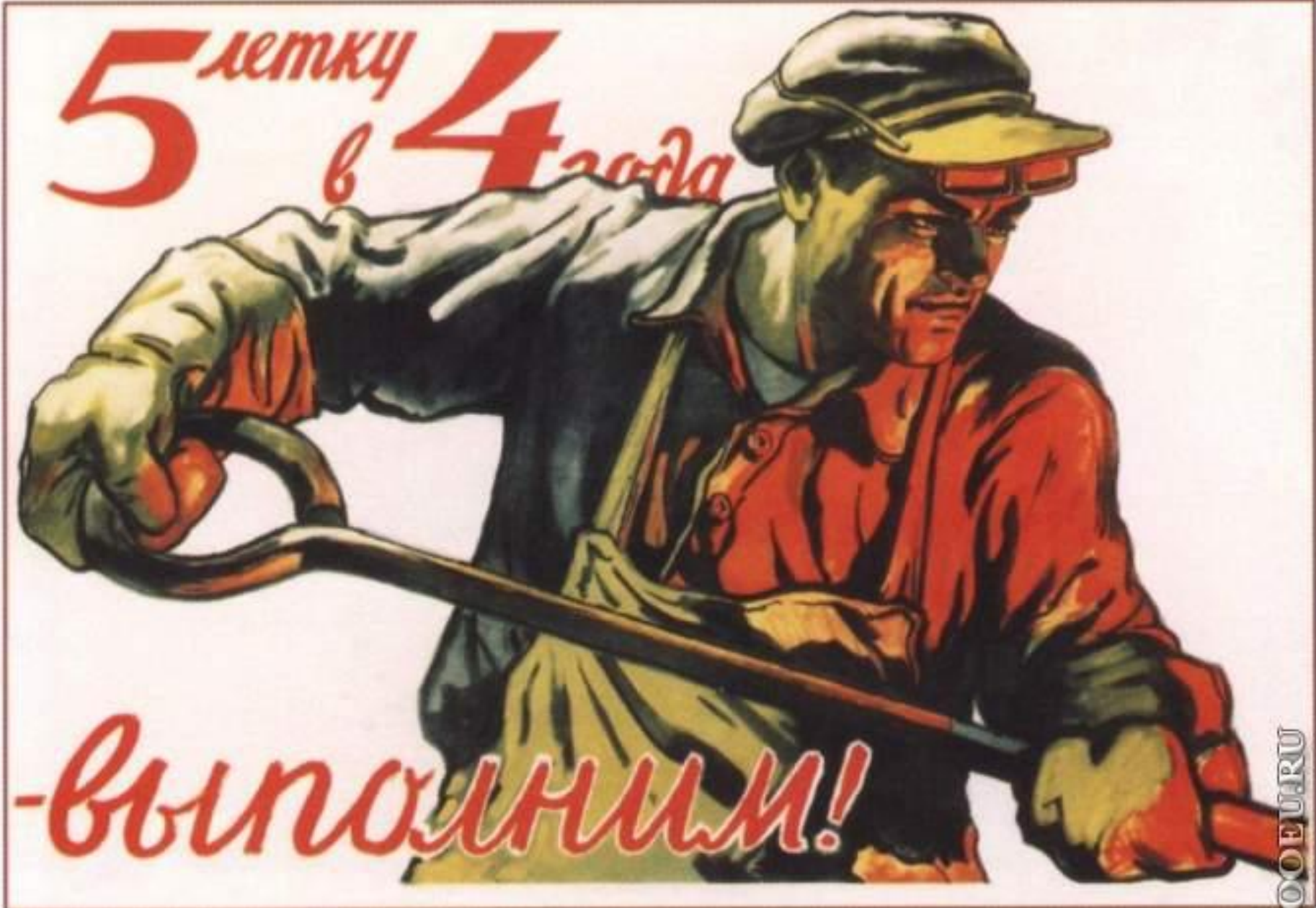
351. Иванов В. 5-летку в 4 года — выполним! 1948