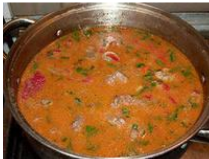
СТЕРЛЯДЬ НА ШАМПАНСКОМ (Редкое блюдо из XVIII века.)