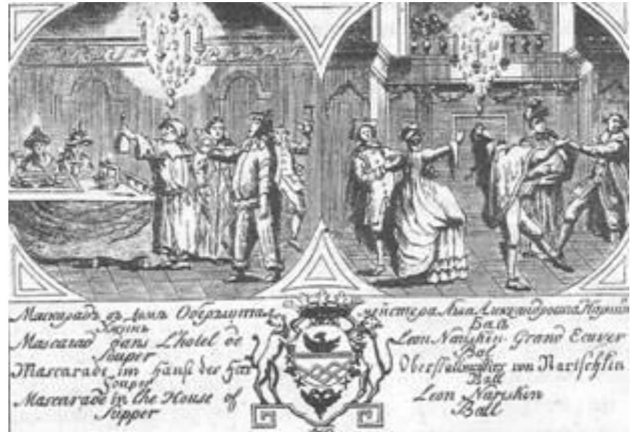
Маскарад в доме Льва Александровича Нарышкина