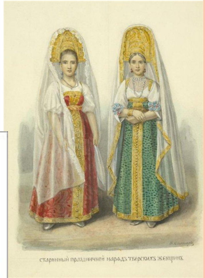
старинный праздничный наряд тверских женщин.