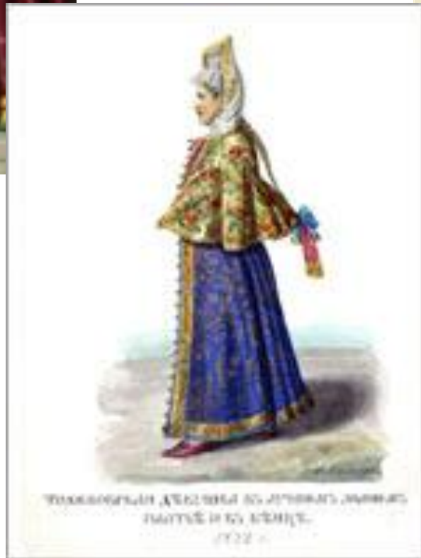
Традиционный костюм из Вологодской области 1922 г.