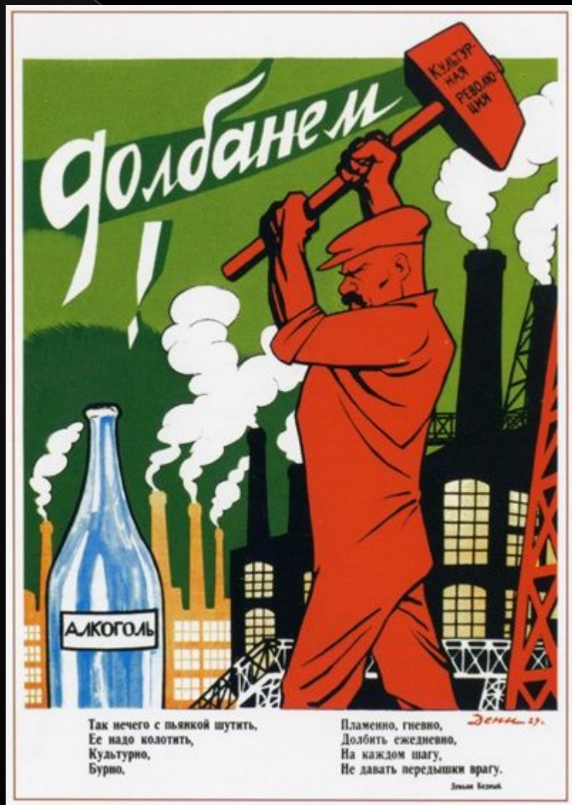
Дени В.Н. «Долбанем» (1930)