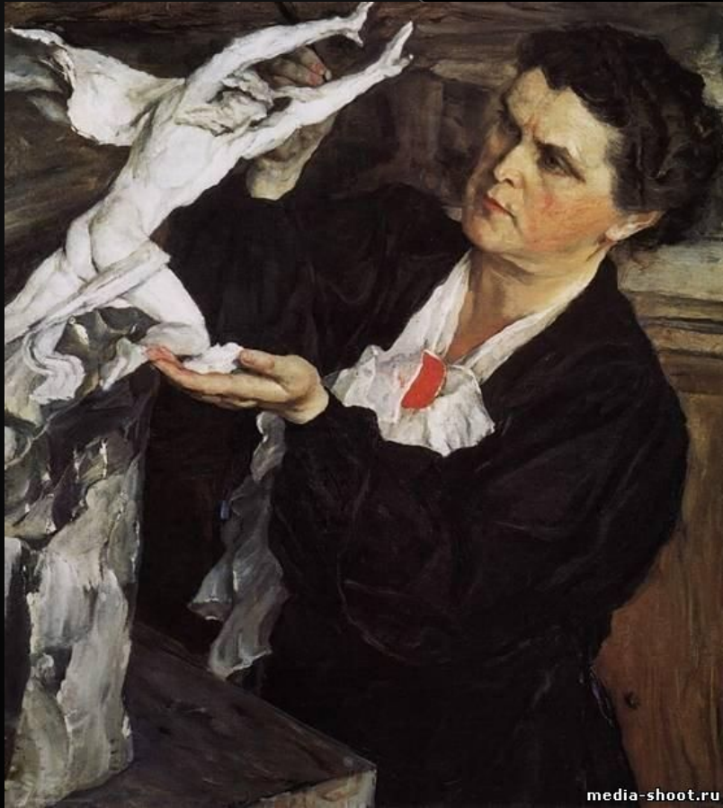
Портрет В.И. Мухиной, 1942 г.