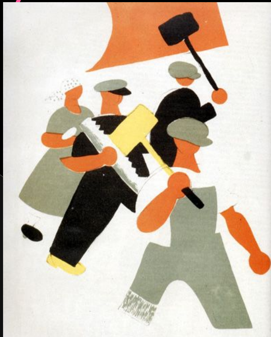
Лебедев В.В. «Первомайское шествие рабочих» (1920)