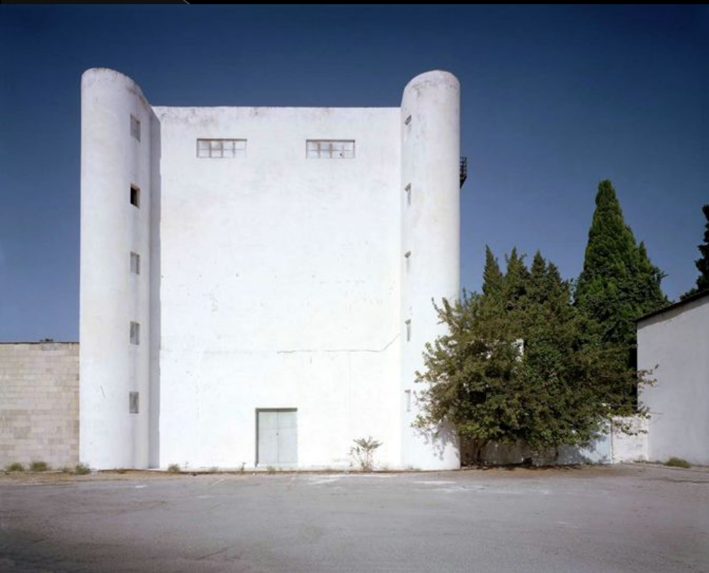
А. Веснин, Л. Веснин. Баку (1928) Рабочий клуб