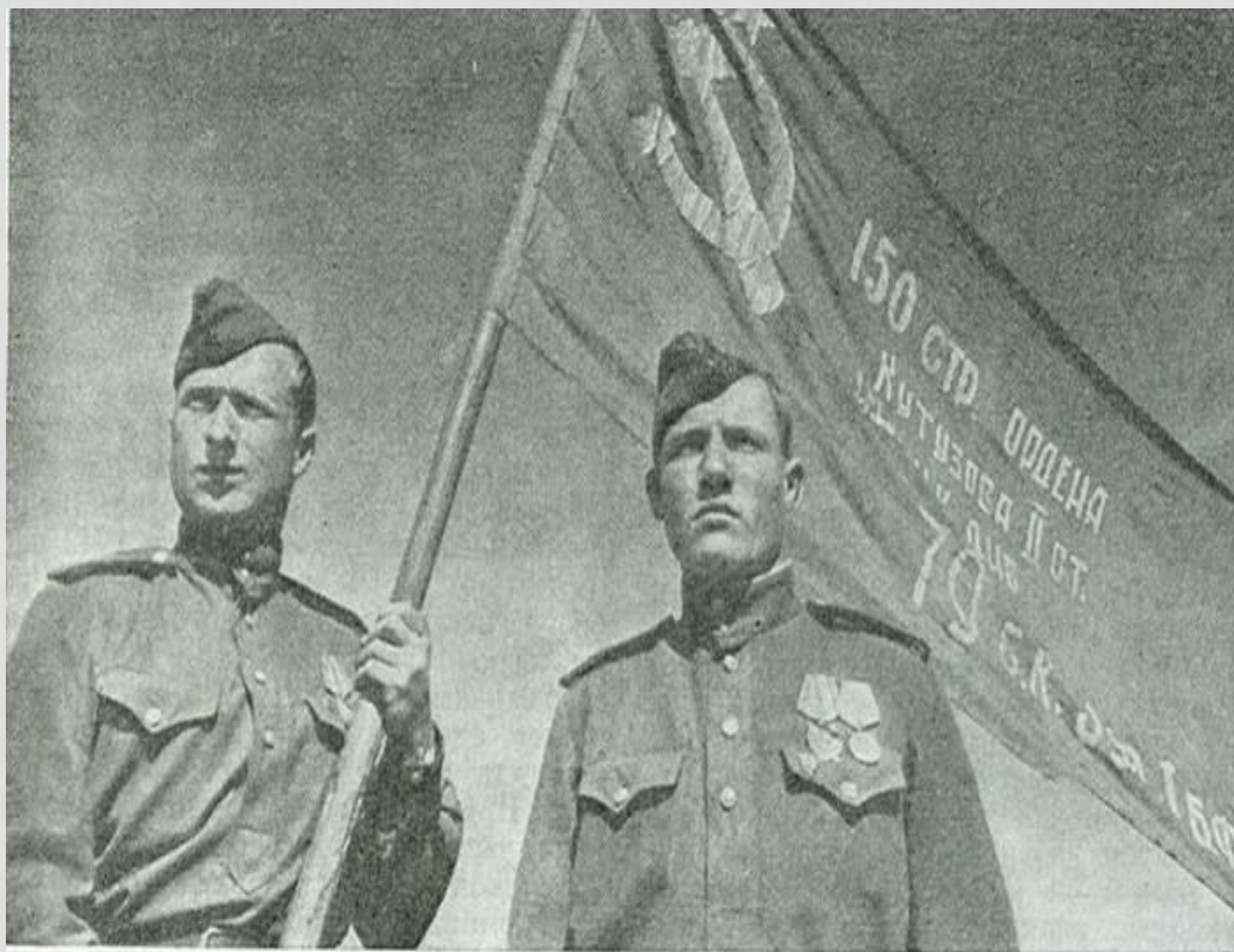
Разведчики 756-го полка 150-й стрелковой дивизии М. А. Егоров (справа) и А. В. Кантария со Знаменем Победы. Берлин. Май 1945.