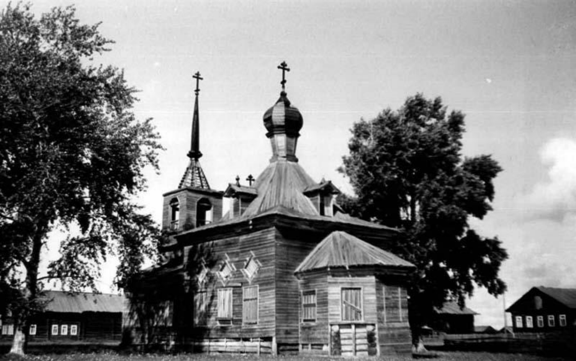
Сретенская церковь в Городке