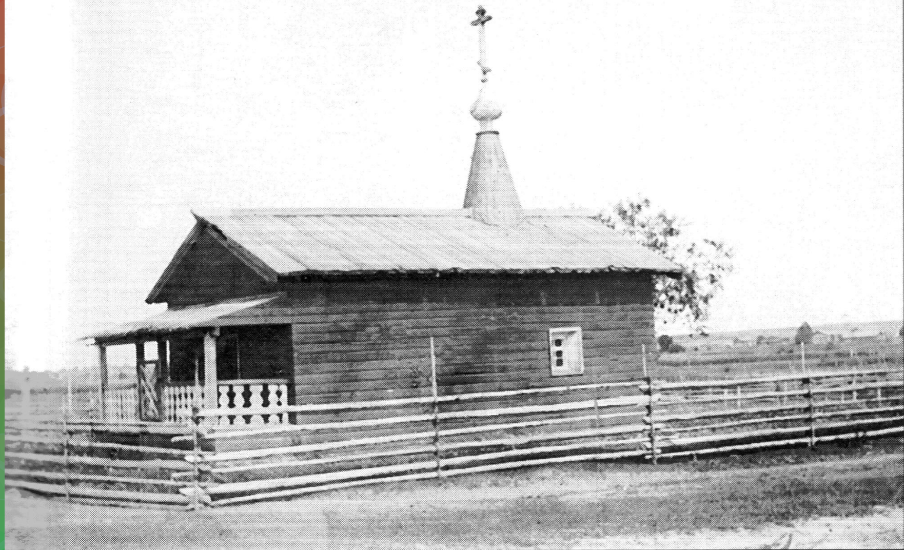
Ильинская часовня. Начало XX века