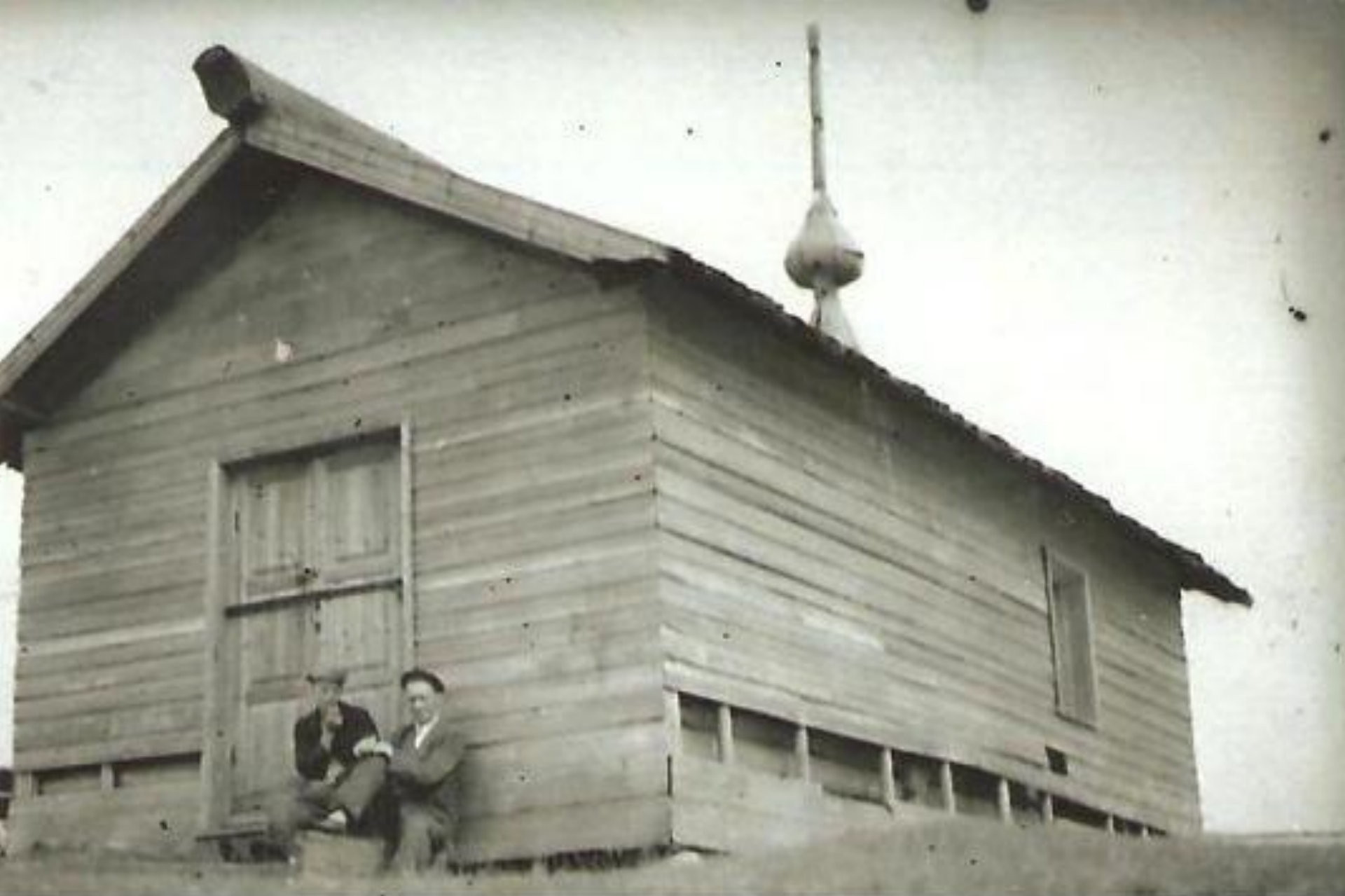
Часовня в Городке.