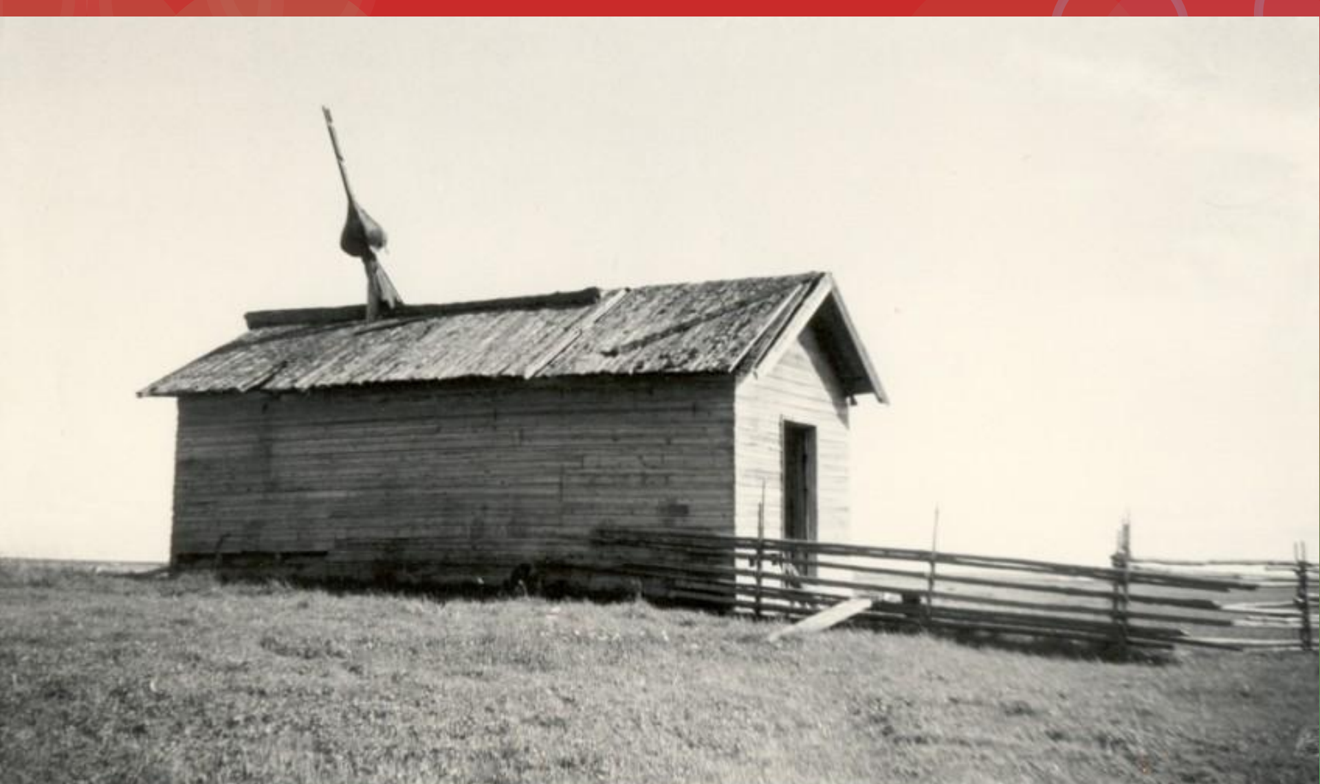
Часовня в Городке.