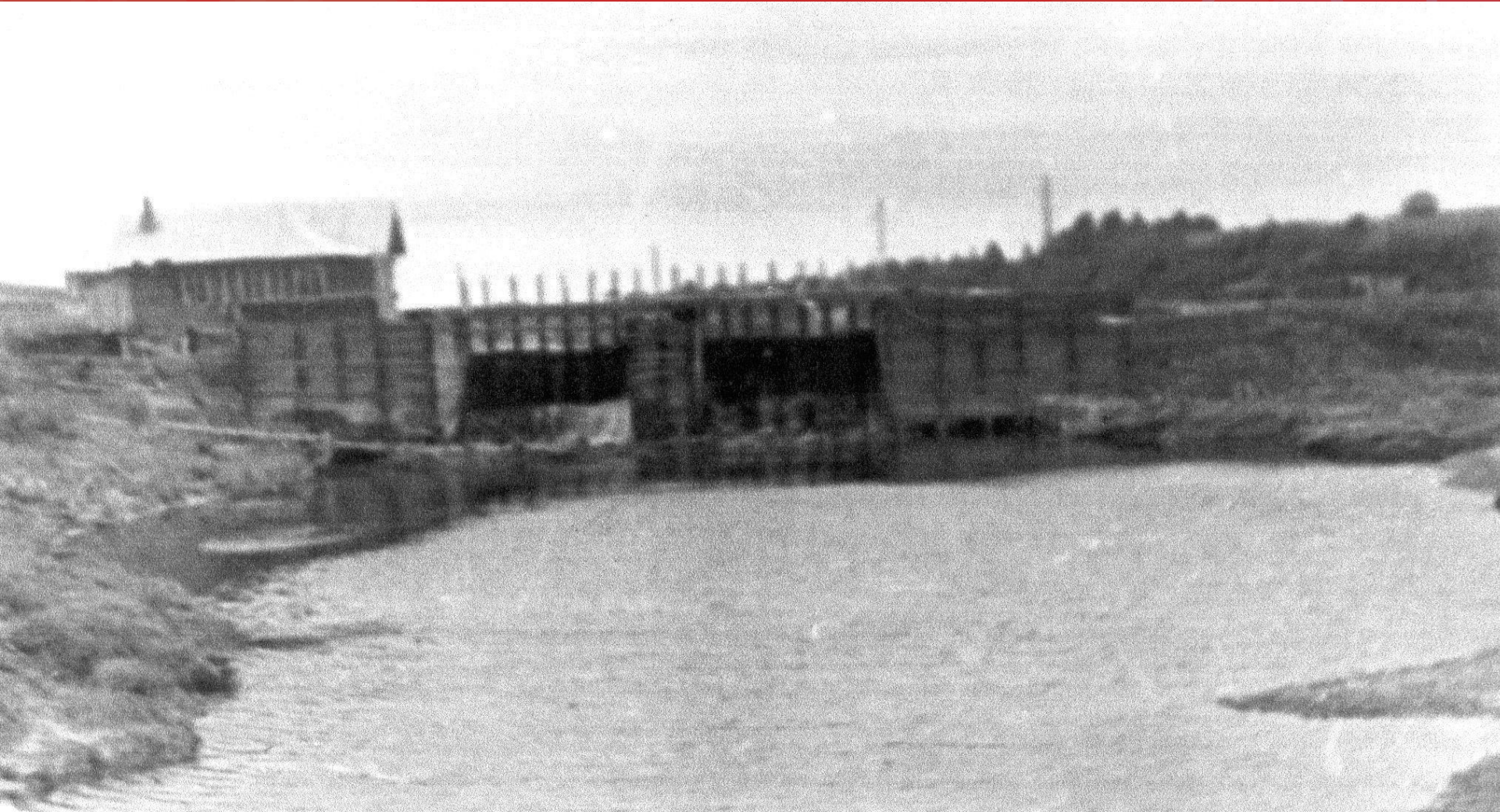
Гидроэлектростанция на реке Тёда.