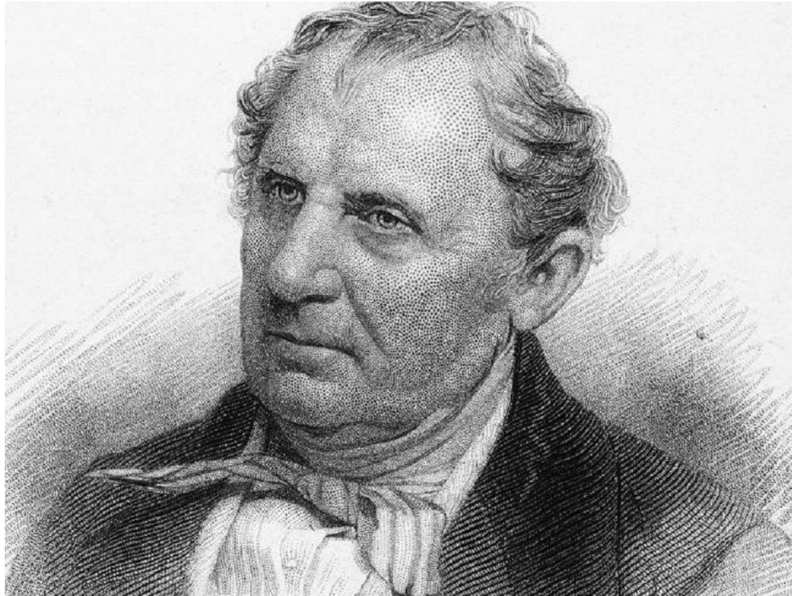
Фенімор Купер (1789-1851)