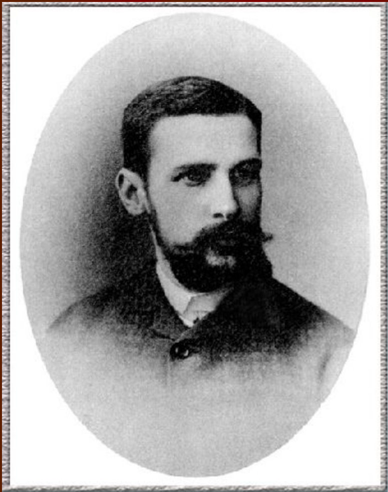
Столыпин - студент Санкт-Петербургского университета, 22 года.