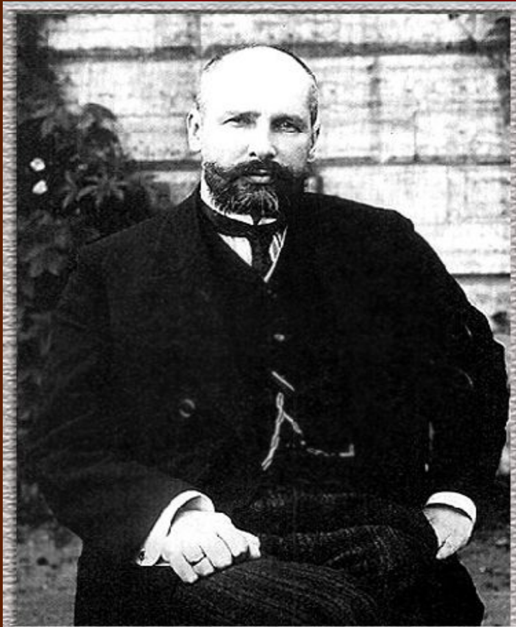
Петр Аркадьевич Столыпин в 1908 году.