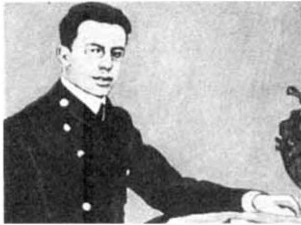
Дмитрий Богров в 23 года (1910). Из справки департамента полиции. Приметы: выше среднего роста, лет на вид 27- 30, худощавый, шатен, румянное лицо, верхняя губа выдается, при разговоре скалит зубы.