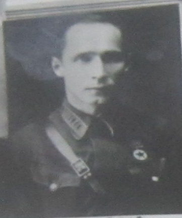
М. И. ГЛИНСКИЙ