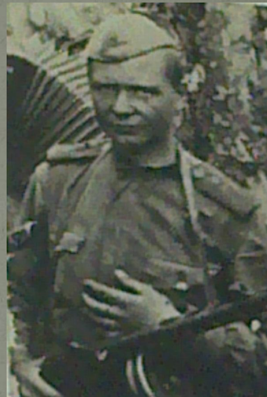
Кочубей Петр Федорович