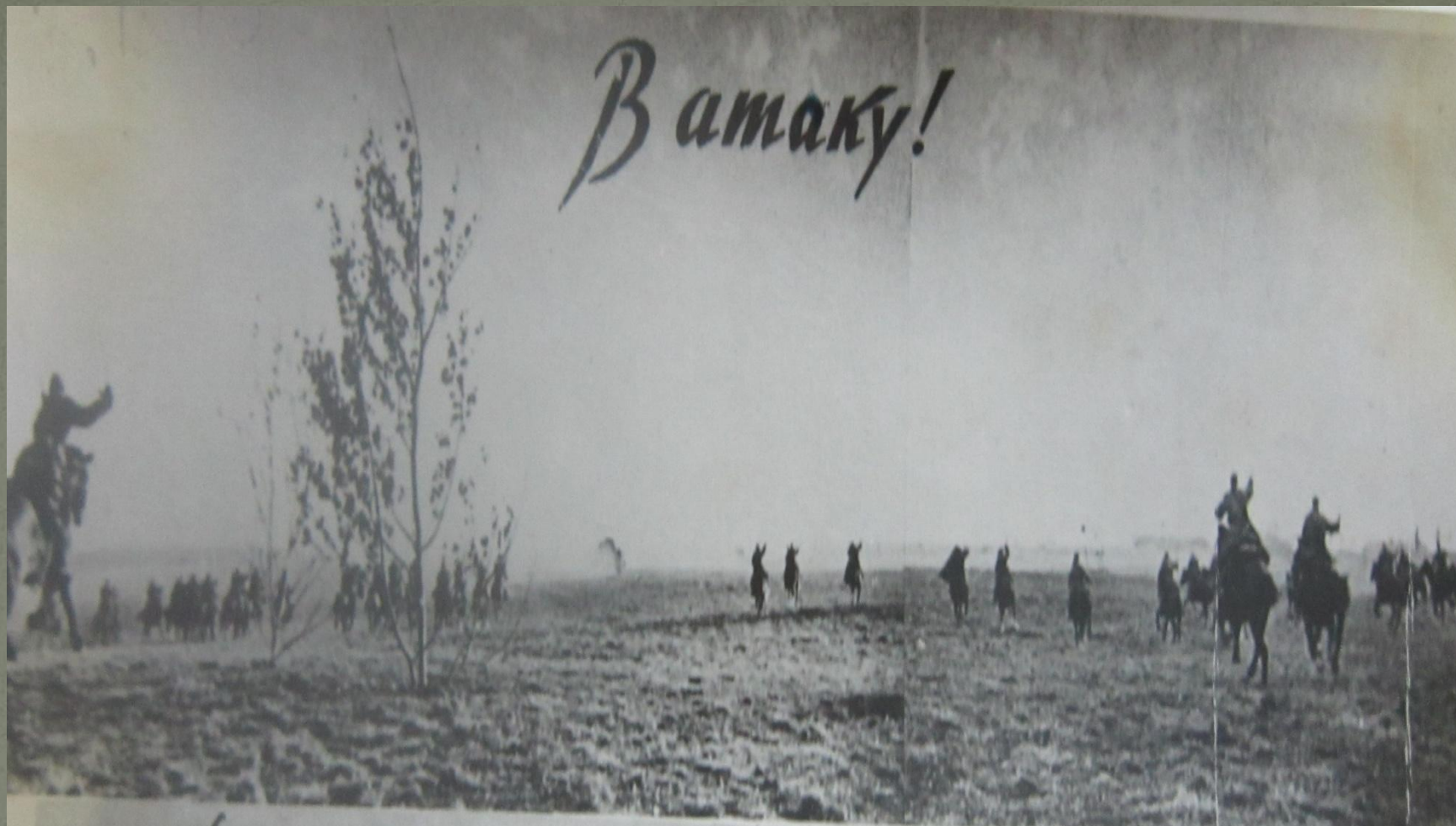
Конники Смоленской кавдивизии атакуют противника на большаке «Рославль-Смоленск»