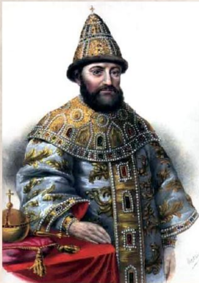
Царь Михаил Федорович

С 1619 до 1633 г. фактическим соправителем Михаила стал его отец патриарх Филарет