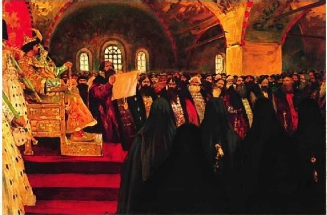
С. Иванов «Земский собор в XVII

Однако к концу его царствования Земские соборы стали собираться только по самым важным поводам (войны, восстания и т.д.)