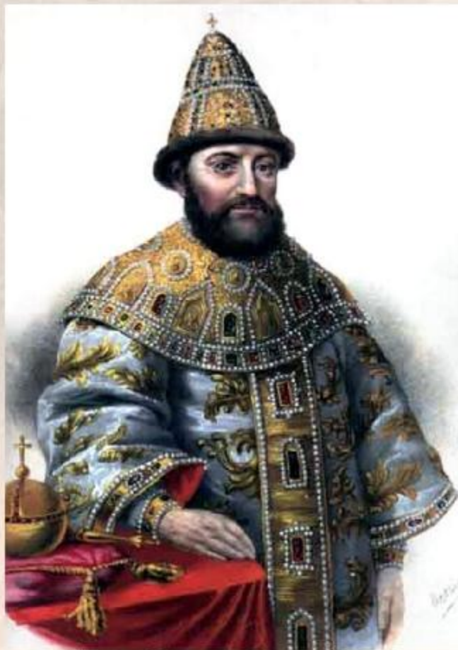
Царь Михаил Федорович

С 1619 до 1633 г. фактическим соправителем Михаила стал его отец патриарх Филарет