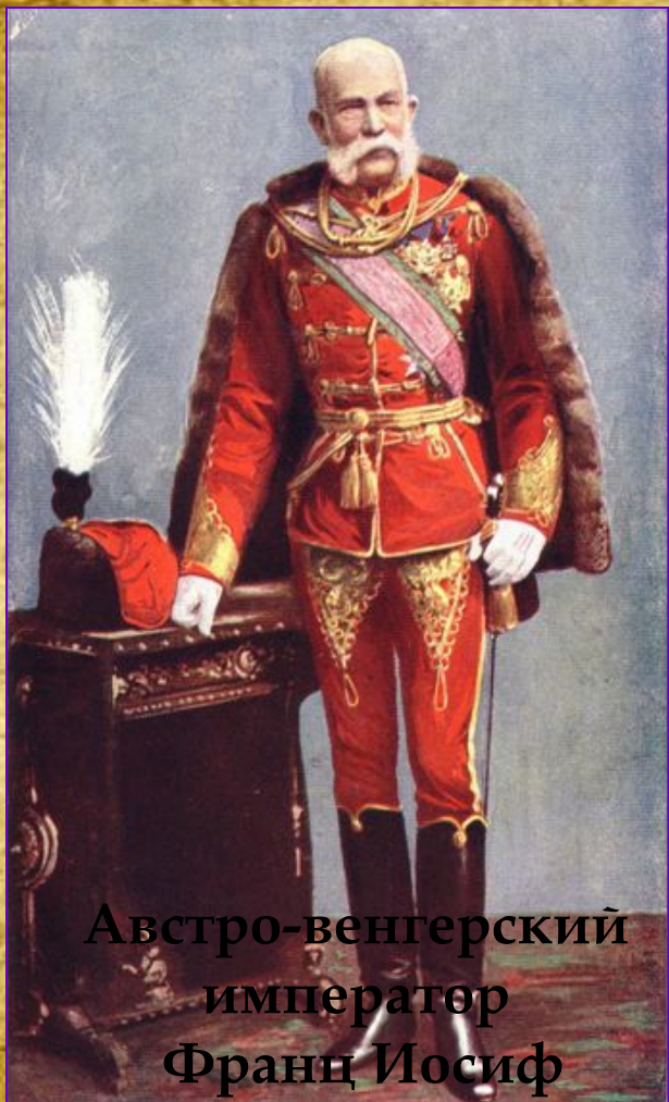
Австро-венгерский император Франц Иосиф

Австро-венгерское правительство дало Сербии 48 часов для выполнения ряда ультиматумов