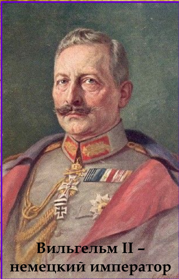
Вильгельм II – немецкий император

После гибели эрцгерцога немецкий император Вильгельм II предложил австро-венгерскому императору Францу-Иосифу «покончить с сербами», используя сараевское убийство как повод для провозглашения войны